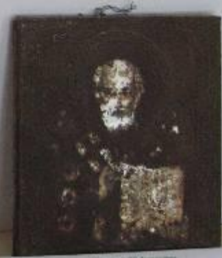
Икона (Св. Николай) изобретение иконописца и иконописца Михаила Фабрика /18 век/