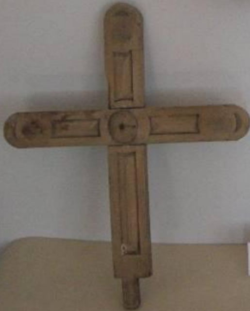
Церковная утварь (липы из Борово / Мухоморова) /18 век/