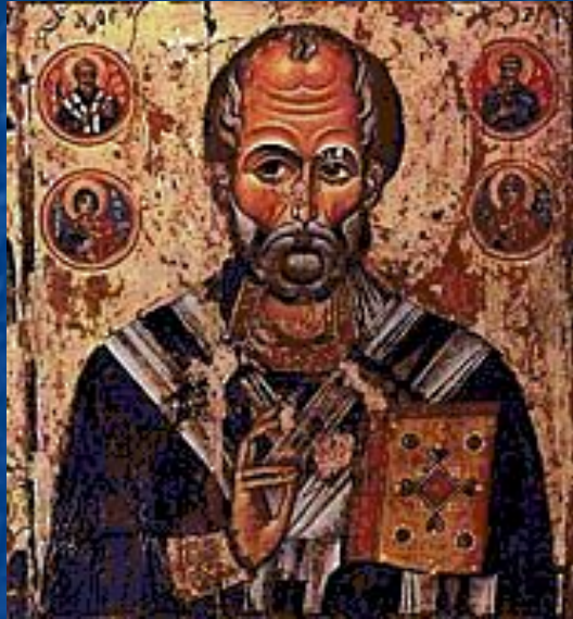
*Икона «Николай Чудотворец»