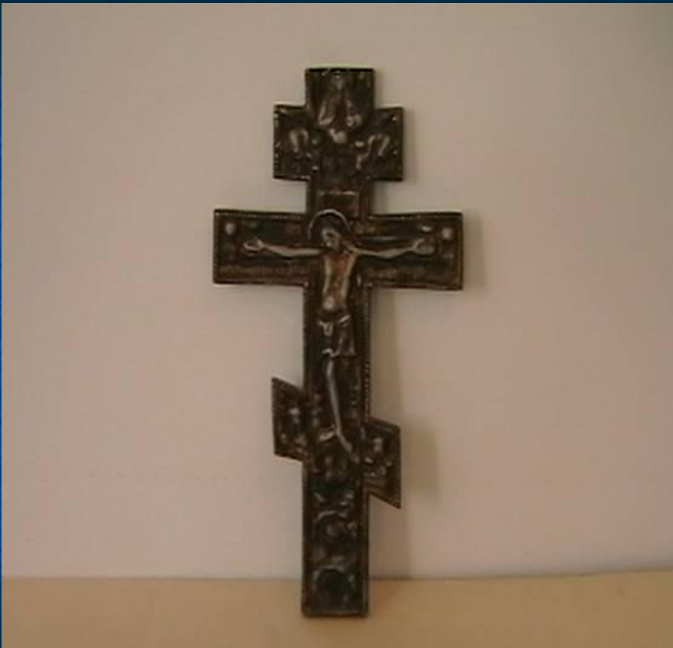
Ритуальный церковный крест