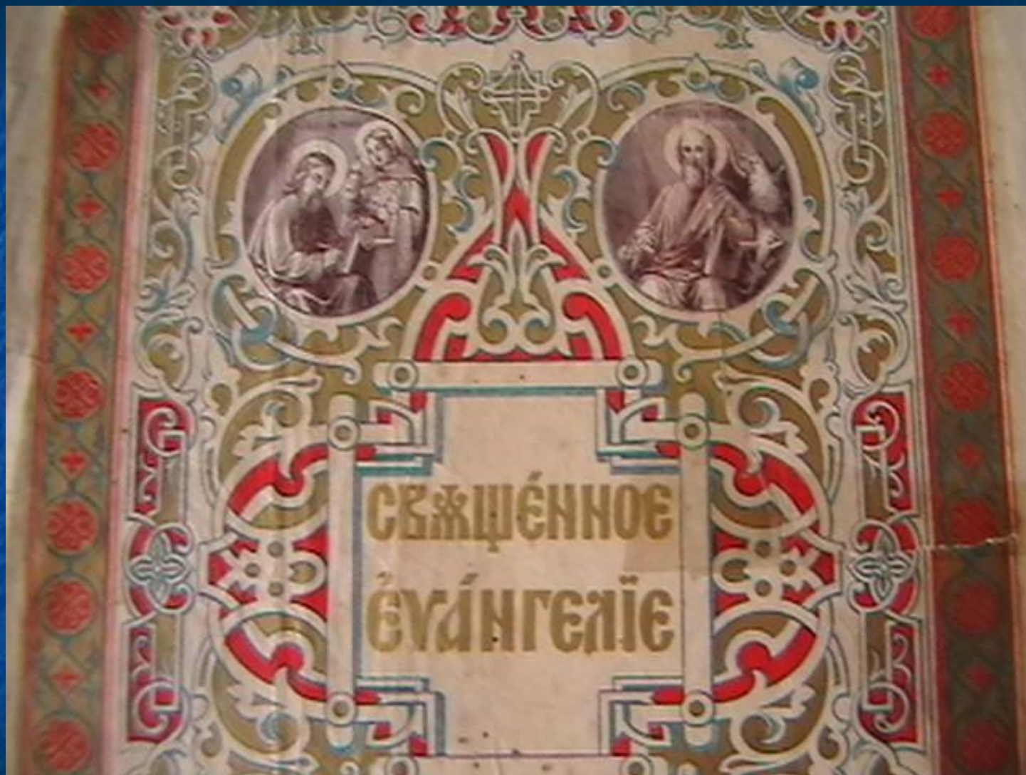
Верхняя часть титульного листа книги