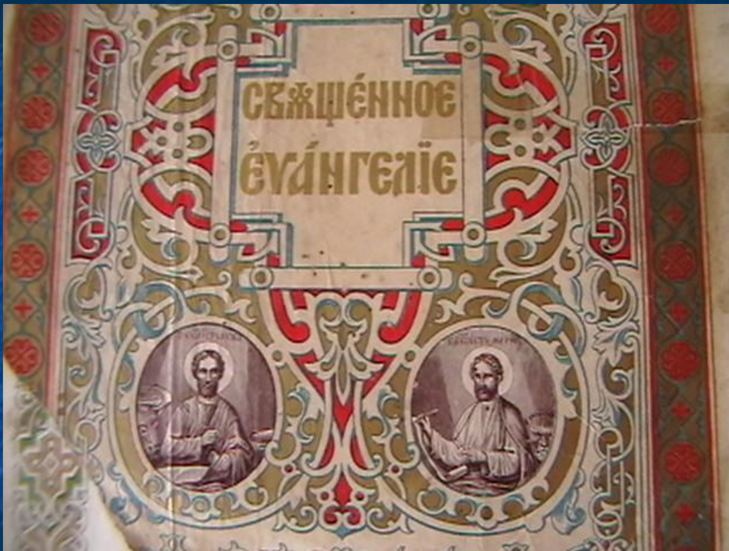
Нижняя часть титульного листа книги