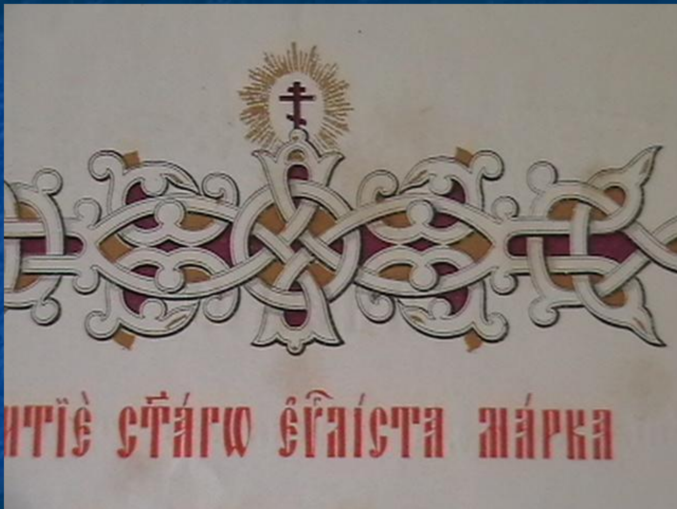
Рисунки и шрифт книги