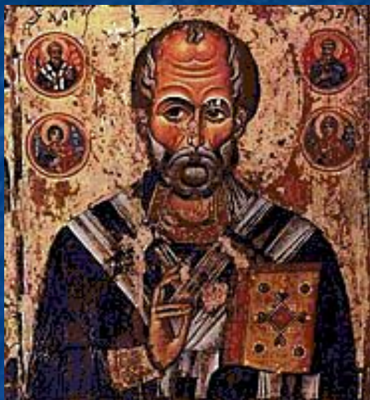
*Икона «Николай Чудотворец»