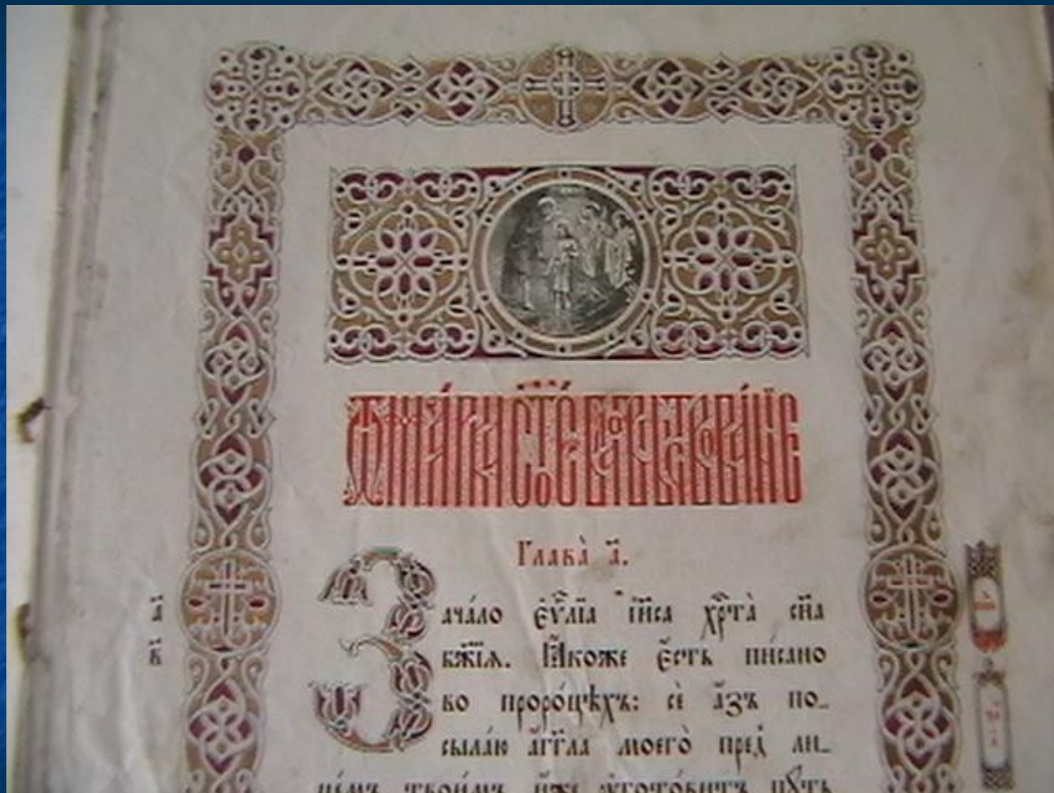
Страница из Священного Евангелия