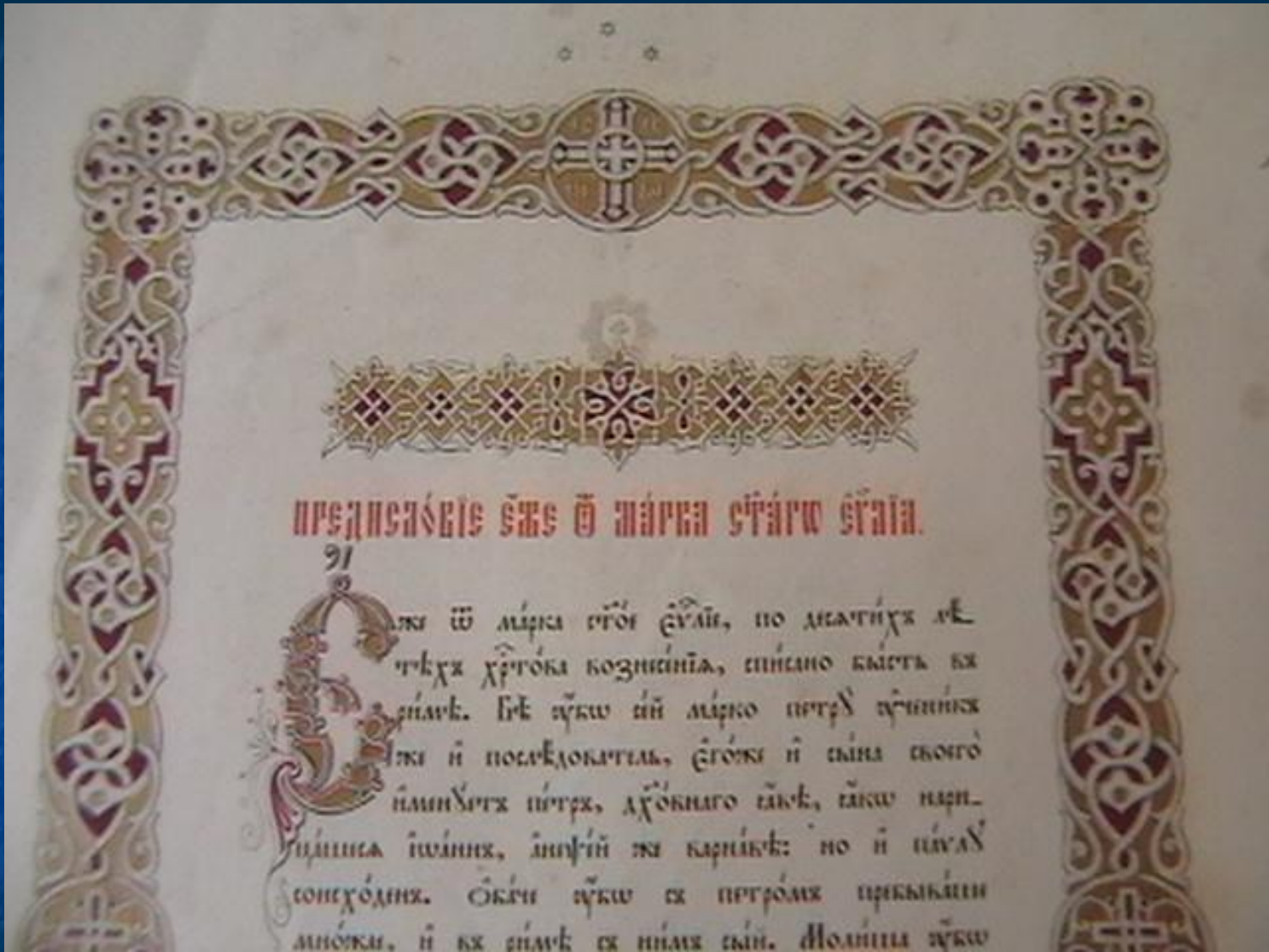
Верхняя часть листа книги