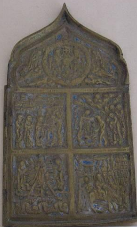
Деталь иконостаса (литьё из бронзы с лазурью) /18 век/