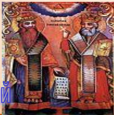
Св. Кирилл и Мефодий

«Кириллица» - славянская азбука, ставшая основой русской азбуки.