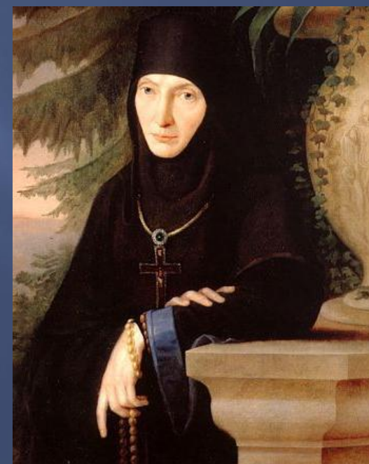
Спасо-Бородинский женский монастырь