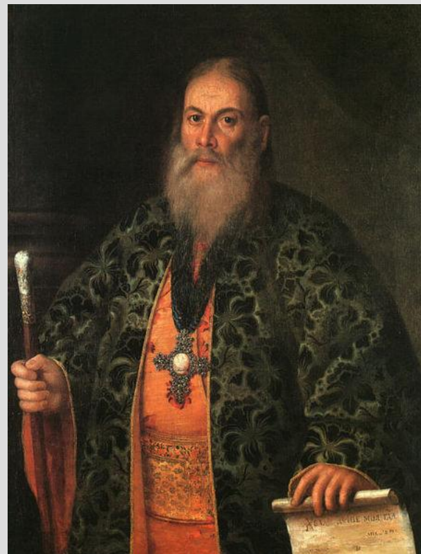
А. Антропов «Протоиерей Фёдор Дубянский»

Протоиерей обычно является настоятелем храма.