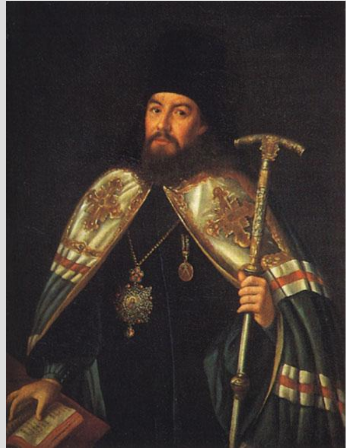
Алексей Антропов Портрет архиепископа Гавриила Петрова