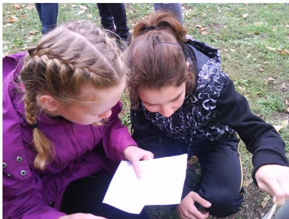
Ориентироваться на местности