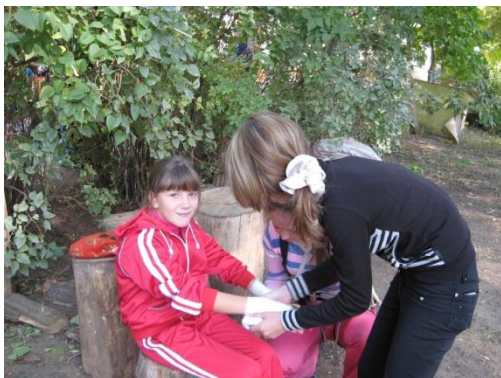
Оказание первой помощи