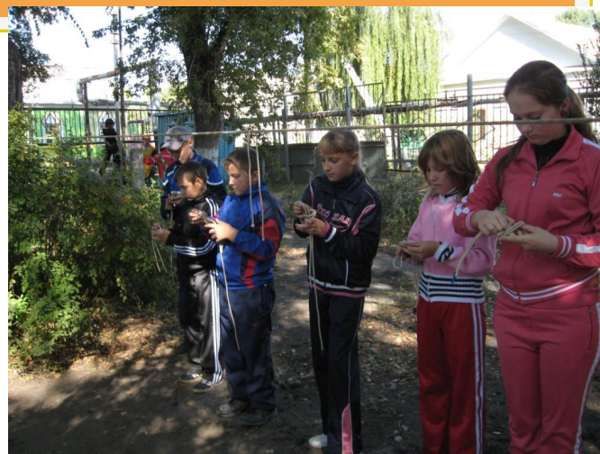
Вязать туристические узлы