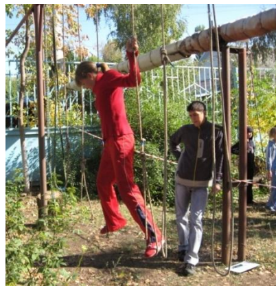
Преодолевать искусственные препятствия