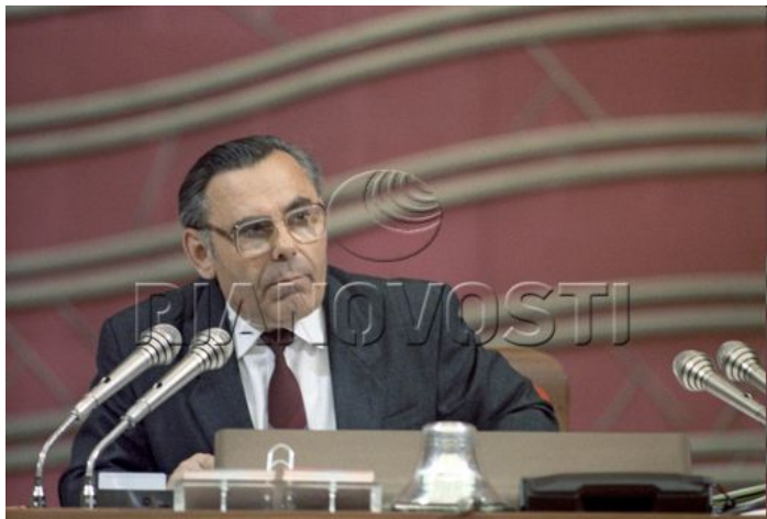
Иван Кузьмич Полозков

Решающее голосование состоялось 29 мая 1990 г.