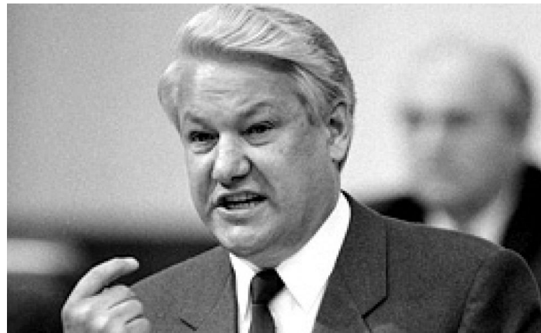
Борис Николаевич Ельцин

Перевесом всего в 4 голоса победу одержал Ельцин . Он стал Председателем Верховного Совета РСФСР