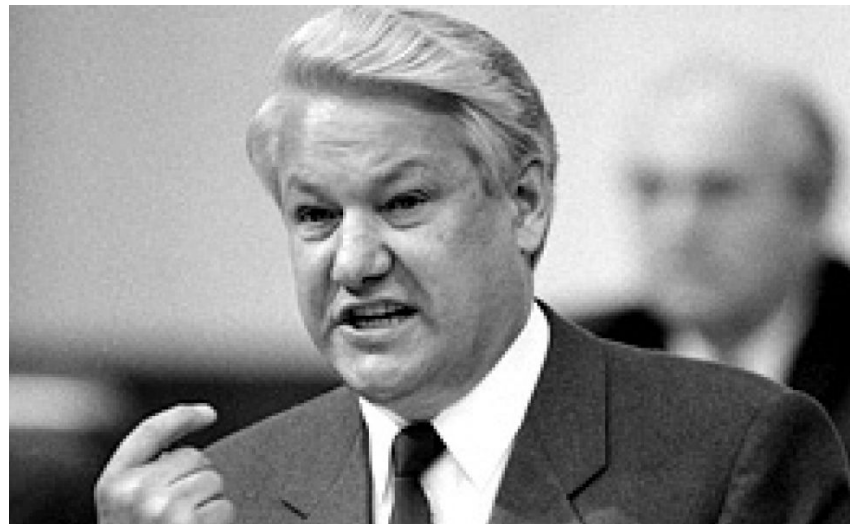
Борис Николаевич Ельцин

На I съезде народных депутатов РСФСР (16 мая - 22 июня 1990 г.) предстояло избрать Председателя Верховного Совета - высшее должностное лицо России