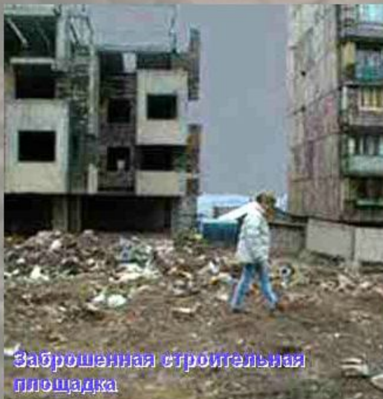
Заброшенная строительная площадка