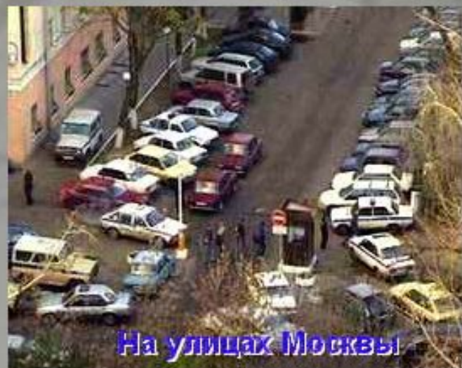
На улицах Москвы