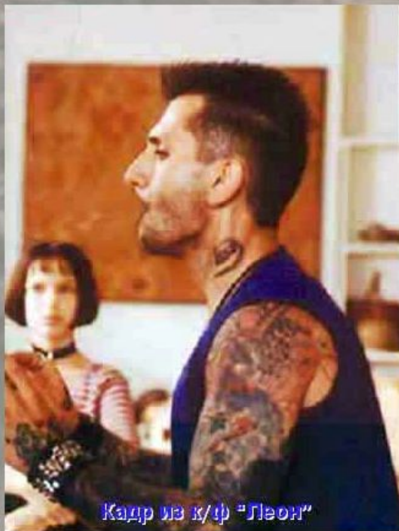
Кадр из к/ф "Леон"