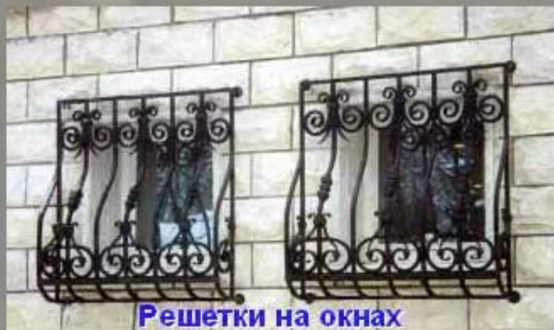
Решетки на окнах