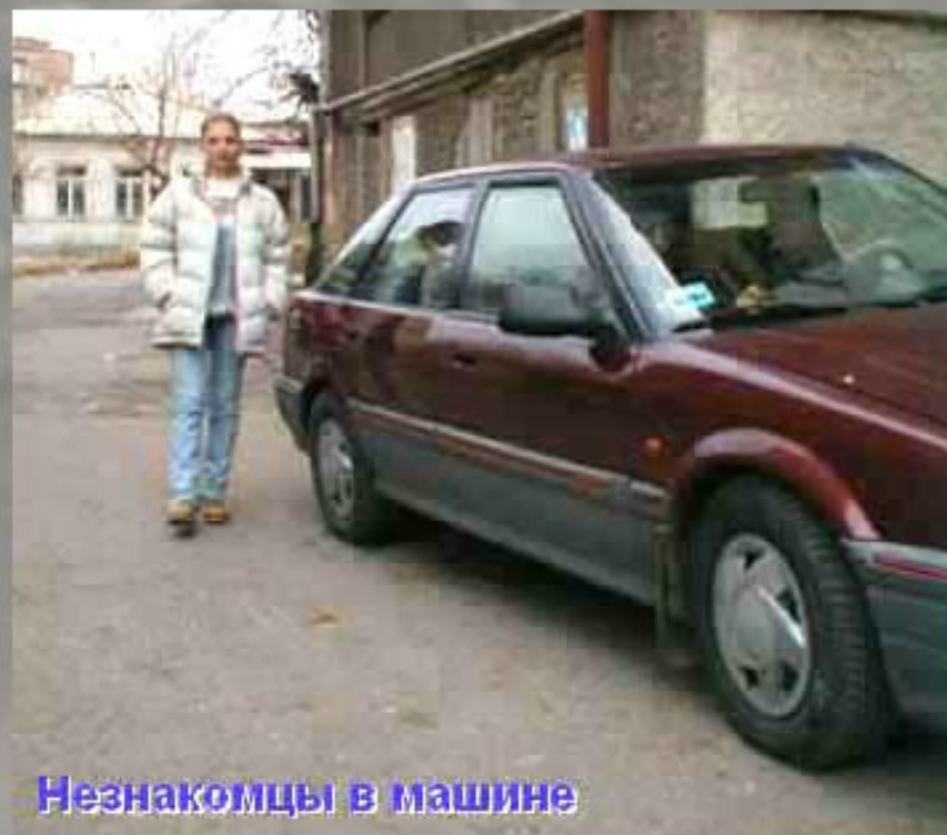
Незнакомцы в машине