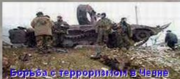
Борьба с терроризмом в Чечне

Не меньше жертвы, чем войны, эпидемии, стихийные бедствия, приносит человечеству преступность, преступные элементы, криминал!