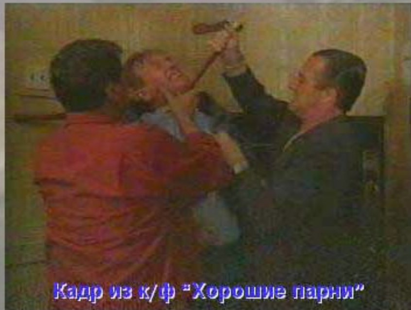
Кадр из к/ф "Хорошие парни"