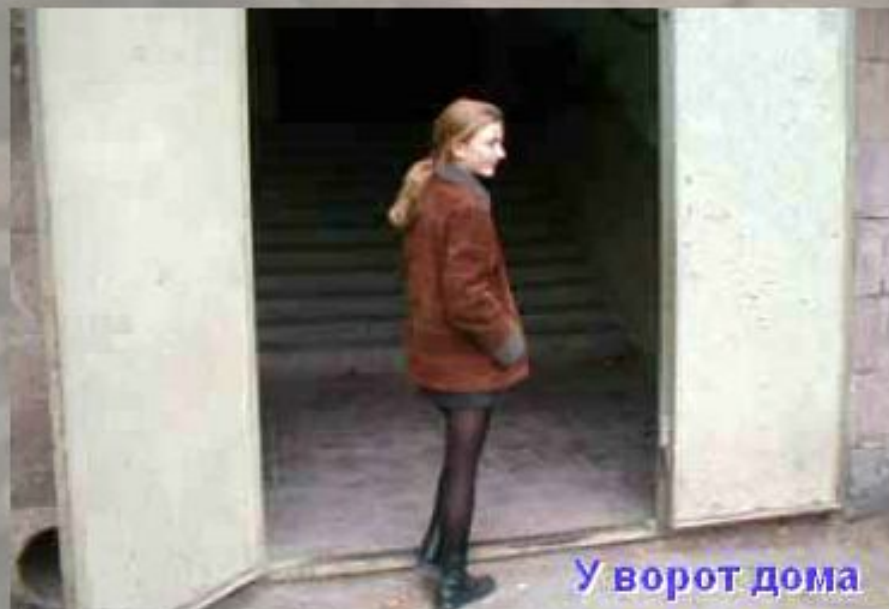
У ворот дома