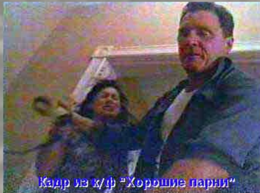
Кадр из к/ф "Хорошие парни"