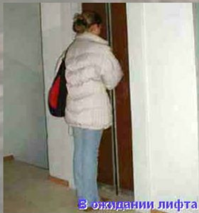
В ожидании лифта