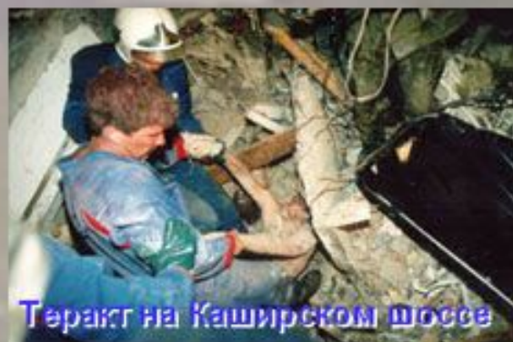
Теракт на Каширском шоссе