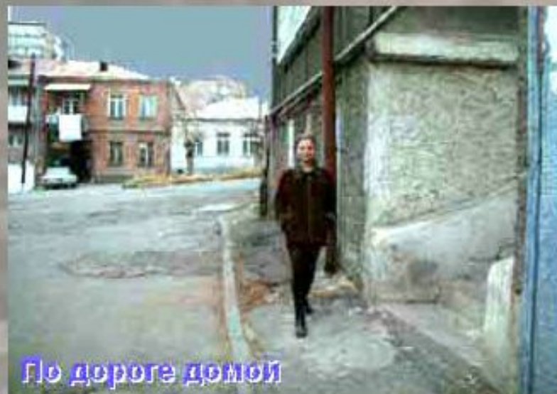
По дороге домой