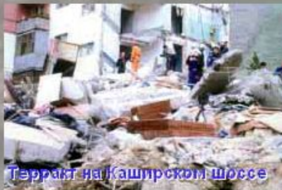
Теракт на Каширском шоссе