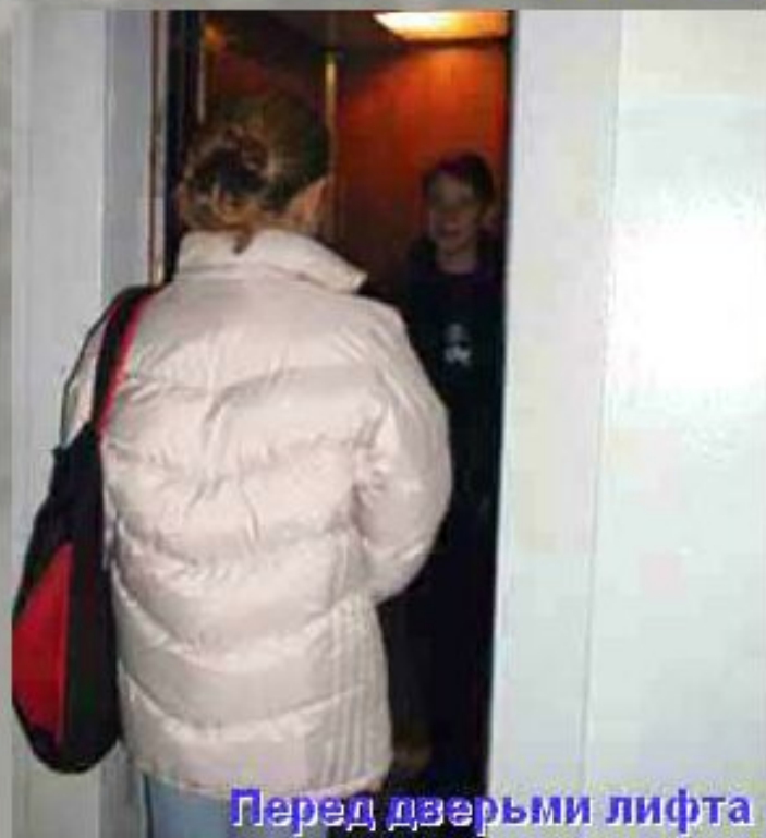
Перед дверьми лифта