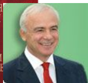
ГЛАВА РЕСПУБЛИКИ АДЫГЕЯ АСЛАН ТХАКУШИНОВ:

«Держим курс на возрождение экономики республики...»