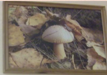
Роц Полина, 7а