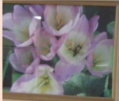
Филиппов Артём, 7а