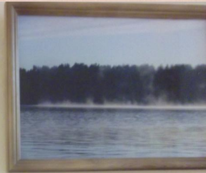
Филиппов Артём, 7а