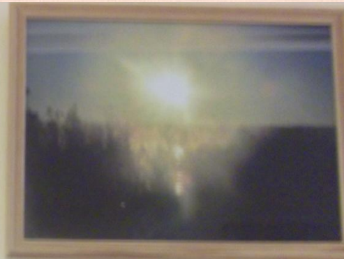
Филиппов Артём, 7а