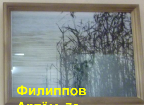
Филиппов Артём, 7а