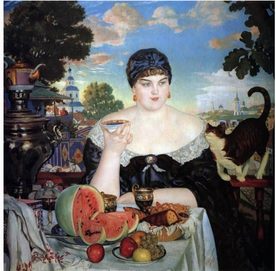
Б.М.Кустодиев «Купчиха за чаем»