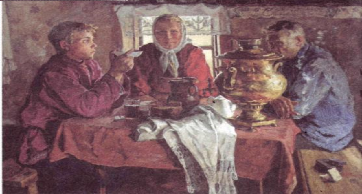
В. Стожаров. « У самовара »