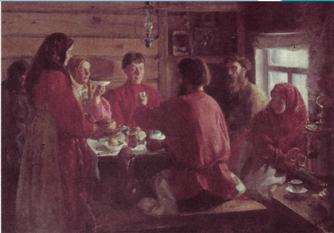
И. Куликов. « В крестьянской избе »