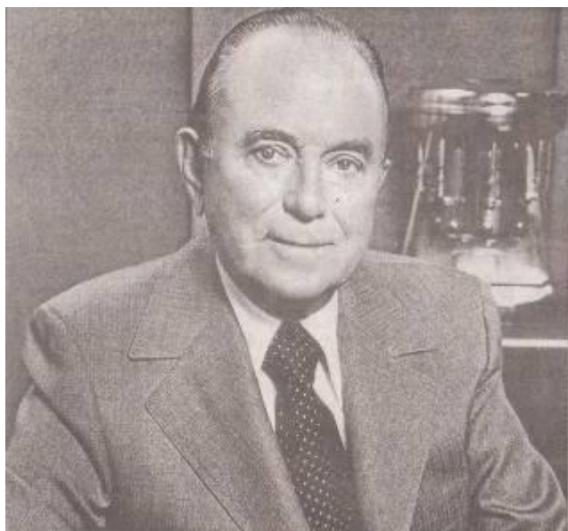
Рей Крок – основатель «MacDonald's Corporation»

Человек, благодаря которому растолстела Америка, был когда-то джазовым музыкантом, торговал всякой-всячиной, пока не забрёл в ресторанчик братьев Мак'Доналдов. Он быстро оценил низкие цены, изменил дизайн, нанял персонал, установил на крыше светящуюся букву «М» и снизил цену гамбургеров в два раза. Установил детские площадки, где в подарок малышам дарили мягкие игрушки. Предприимчивый Рей Крок действовал гениально – дети силком тащили родителей в «Макдональдс».