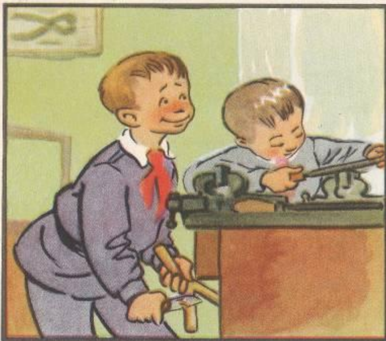
старательно трудился на уроках труда,