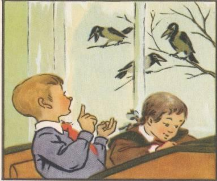
На уроках арифметики Костя усердно считал,