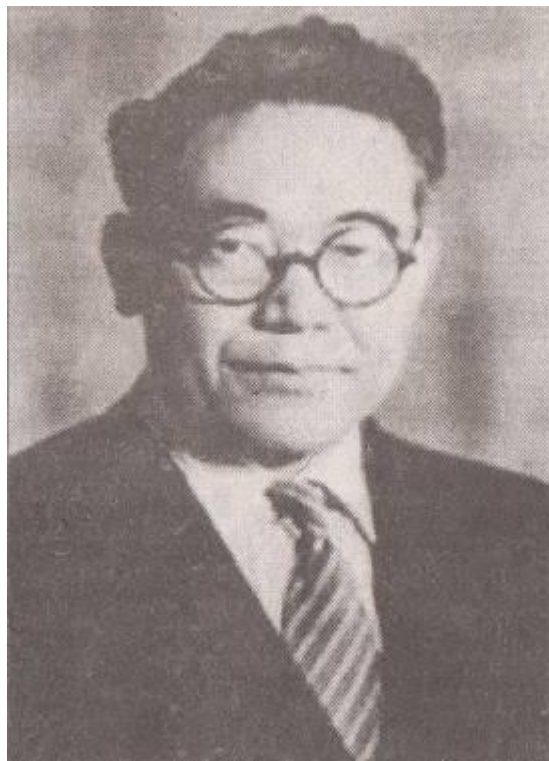
Тойода Киичиро – основатель компании Toyota Motor Corporation

Киичиро является продолжателем дела своего отца, по его наказу он четыре года упорно перебирал по винтикам европейские авто , пока в 1935 году не выпустил свой первый автомобиль А1 или АА. Но первые 20 автомобилей были еле-еле проданы. И все-таки упрямый Тойода в 1937 году основал фирму, получил лицензию и приступил к выпуску грузовиков. Японские автомобили затмили американские!