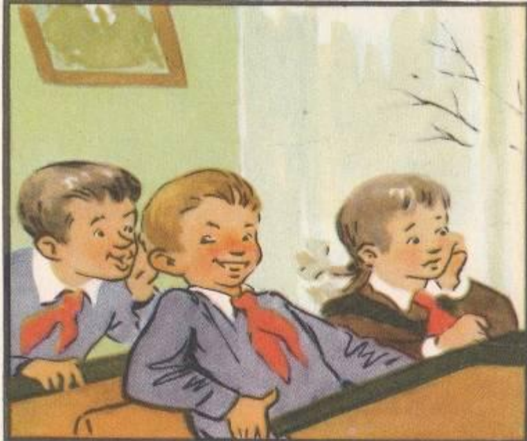
на уроках грамматики внимательно слушал,