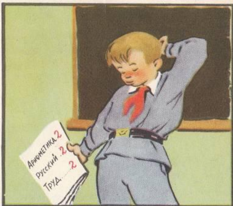
...но почему-то все время получал двойки