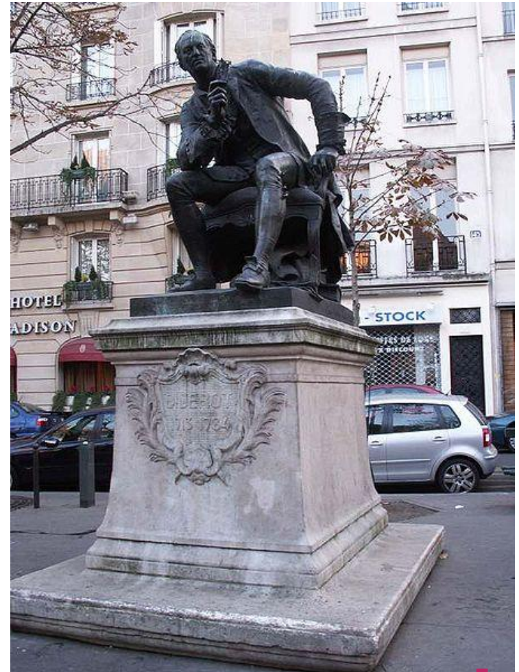
Памятник Д.Дидро в Париже