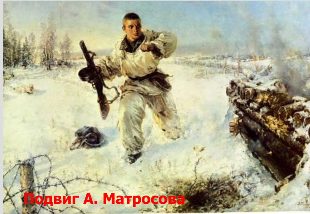
Подвиг А. Матросова

Советские воины, проявив беспримерную храбрость, доказали своё превосходство над очень сильным и коварным врагом.