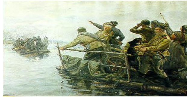
Форсирование Днепра с 26 августа-23 декабря 1943г. Ю. Непринцев. «Форсирование Днепра»