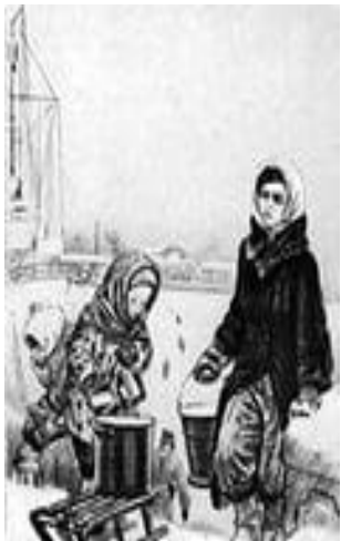
Блокада Ленинграда с 15 сентября 1941 по 18 января 1943 г. А.Пахомов «На Неву за водой».