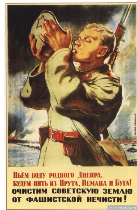
В.Иванов «Пьем воду родного Днепра...»