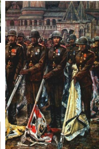
Парад 24 июня 1945 года на Красной площади в Москве. К. Антонов. «Победители»