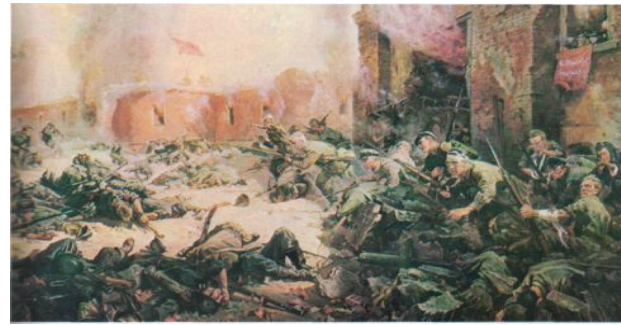
Гарнизон крепости защищался с 22 июня-по август 1941 г. П. Кривоногов. «Защитники Брестской крепости»