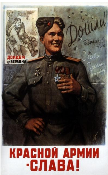
Л.Ф Голованов. «Красной Армии – Слава!»