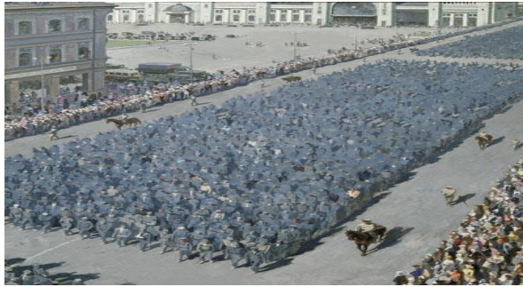
Марш пленных немцев состоялся в Москве 17 июля 1944 г. А. Михайлов. «Пленные в Москве».