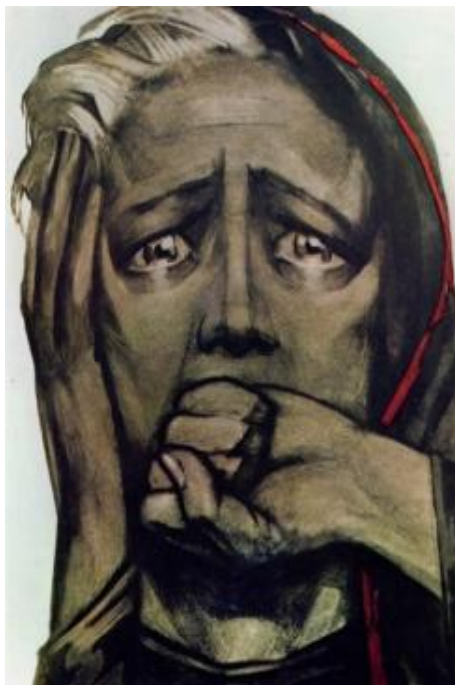
В.Б. Корецкий. «Будь вы прокляты»