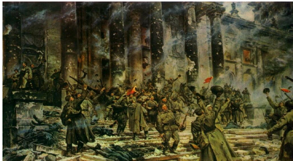
Взятие Берлина. Победа - 9 мая 1945 года П.А. Кривоногов «Победа».