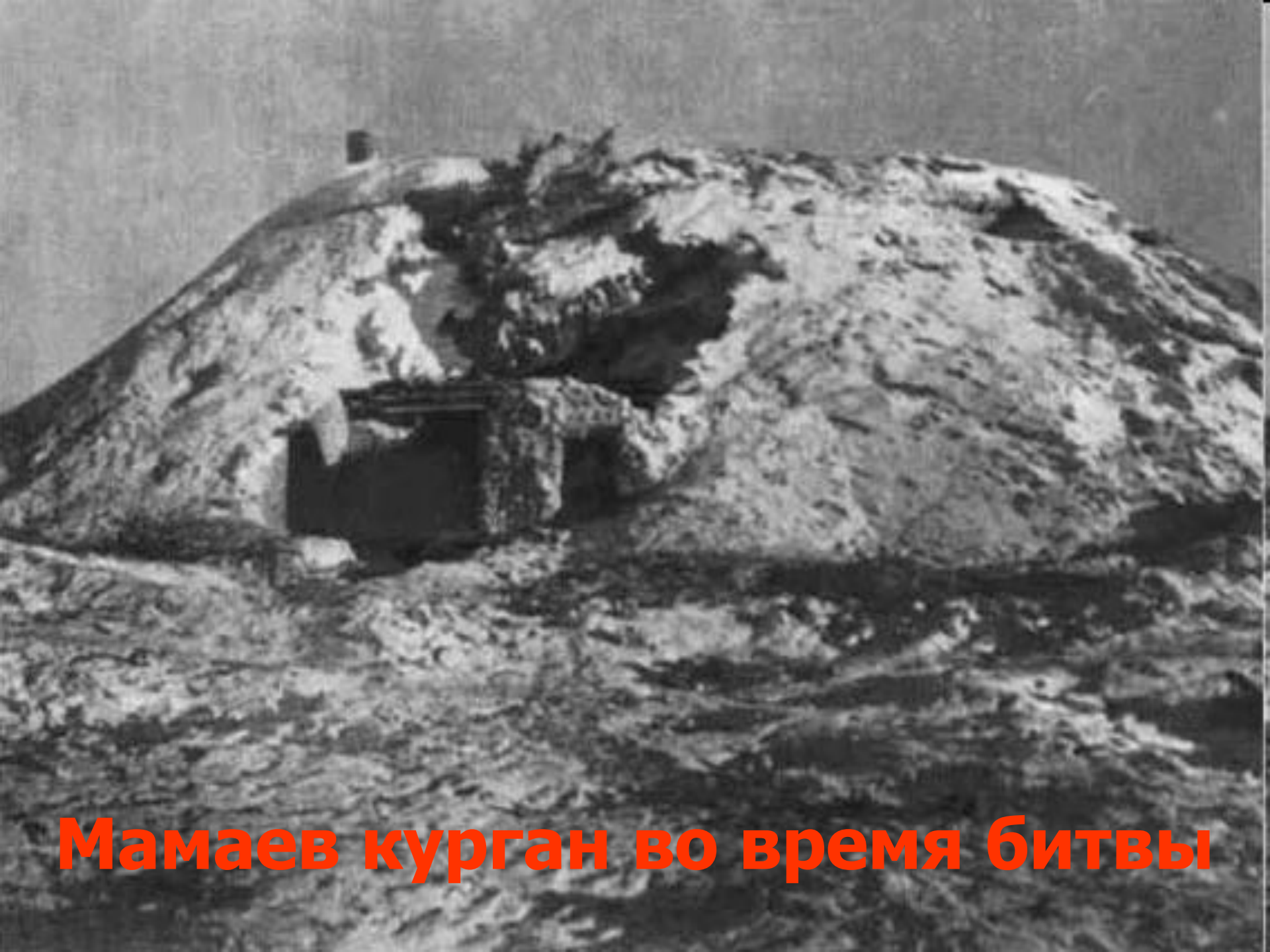
Мамаев курган во время битвы