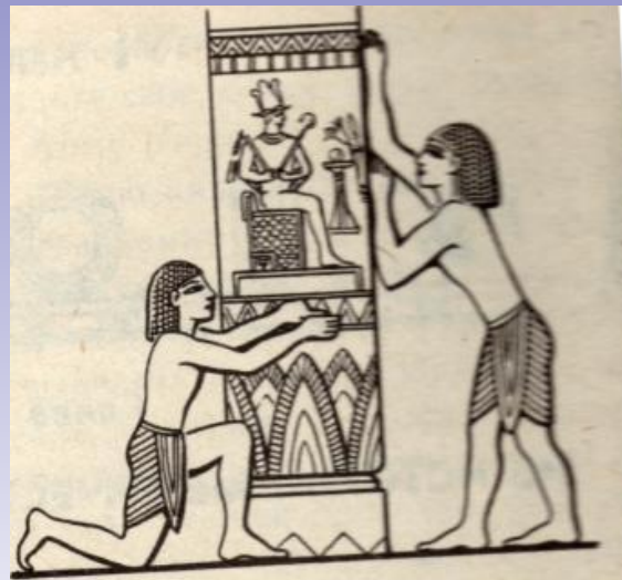
Измерение длин локтями и пальцами