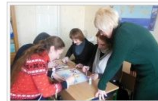
Майстер-клас вчителів англійської мови