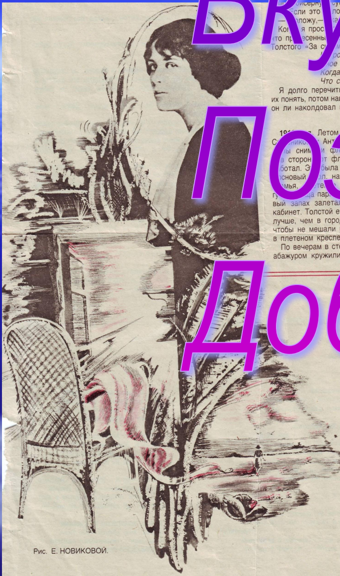
Рис. Е. НОВИКОВОЙ.