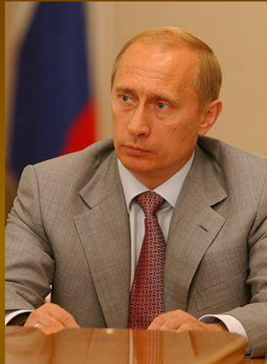
Владимир Владимирович Путин

Избирался Президентом два раза (12 июня 1991 – 31 декабря 1999 г)