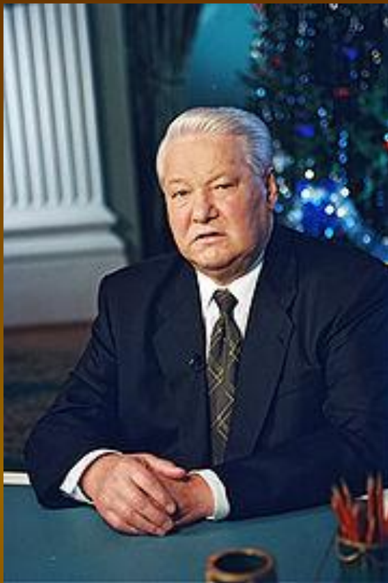
Борис Николаевич Ельцин

Избирался Президентом два раза (12 июня 1991 – 31 декабря 1999 г)