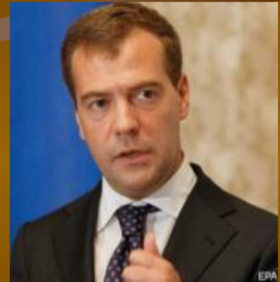
Медведев Дмитрий Анатольевич

Третий Президент Российской Федерации (2 марта 2008 по н. время)