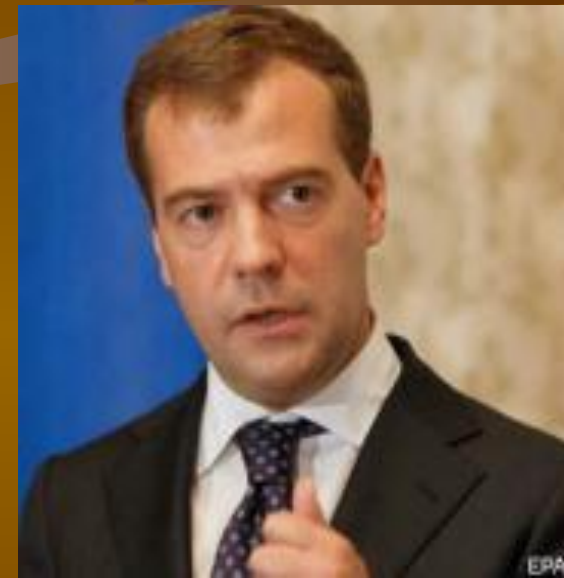
Медведев Дмитрий Анатольевич

Третий Президент Российской Федерации (2 марта 2008 по н. время)