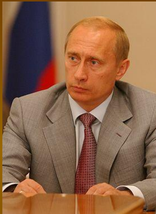
Владимир Владимирович Путин

Избирался Президентом два раза (12 июня 1991 – 31 декабря 1999 г)