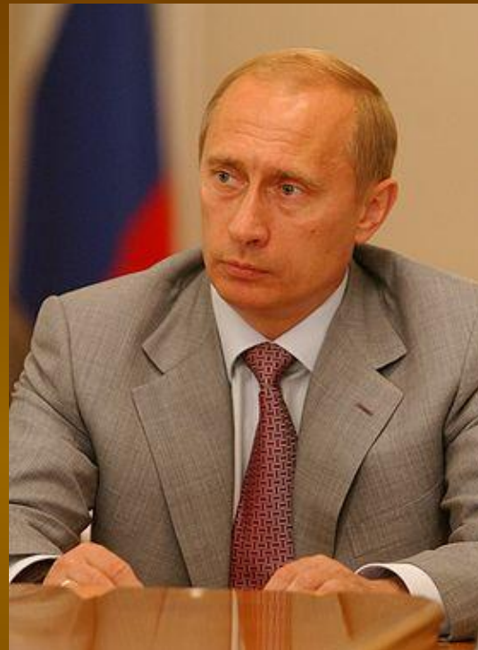
Владимир Владимирович Путин

Избирался Президентом два раза (12 июня 1991 – 31 декабря 1999 г)