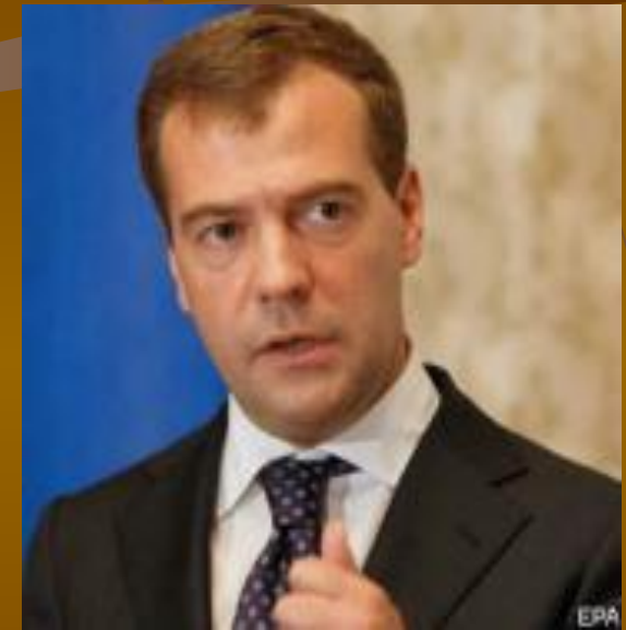
Медведев Дмитрий Анатольевич

Третий Президент Российской Федерации (2 марта 2008 по н. время)