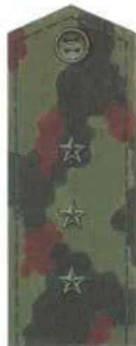
Старший прапорщик (полевая форма одежды)