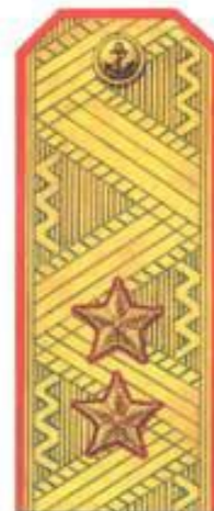
Генерал-лейтенант (парадная форма одежды, береговые войска)