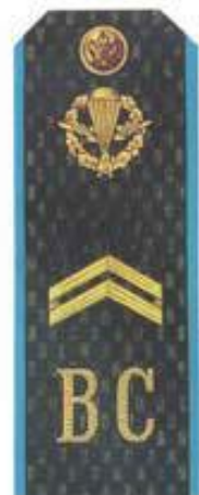
Младший сержант (ВДВ)