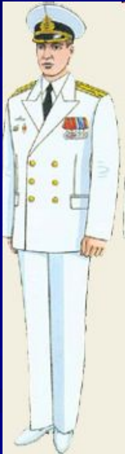
парадная для строя и вне строя