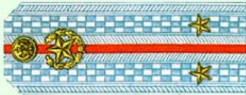
Лейтенант (парадная форма одежды)