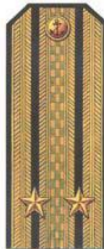
Капитан 2 ранга (парадная форма одежды)