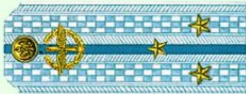
Старший лейтенант (парадная форма одежды, ВВС)