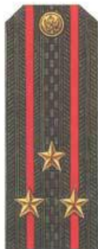
Полковник (повседневная форма одежды)