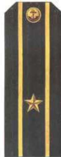
Капитан 3 ранга (повседневная форма одежды)