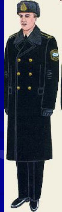
повседневная для строя и вне строя