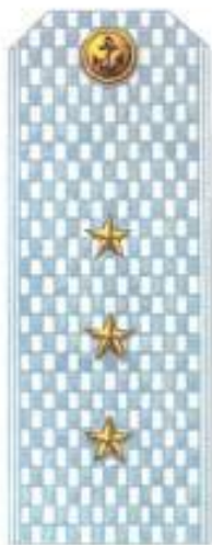
Старший мичман (парадная форма одежды, ВМФ)