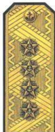
Адмирал флота (парадная форма одежды)