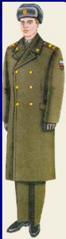
парадная вне строя