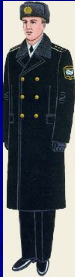
парадная для строя и вне строя