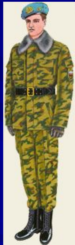
парадная для строя повседневная и вне строя ВДВ