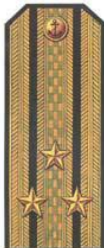
Капитан 1 ранга (парадная форма одежды)