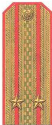
Подполковник (парадная форма одежды)