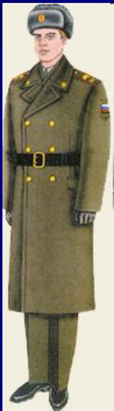
парадная для строя