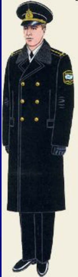
парадная для строя и вне строя