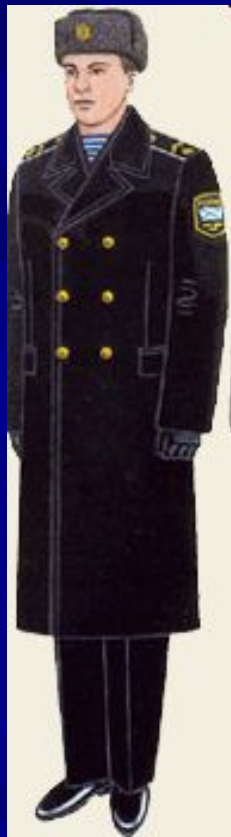
парадная вне строя