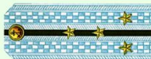
Капитан-лейтенант (парадная форма одежды, ВМФ)