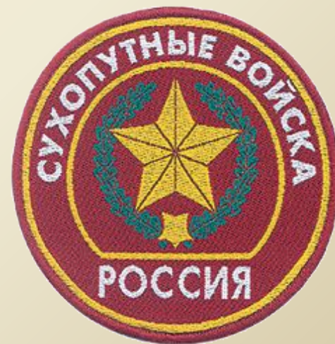
Нарукавный знак Сухопутных войск РФ