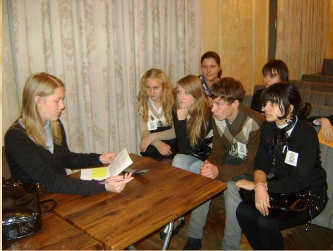
Игра «Фемида», Аничков дворец