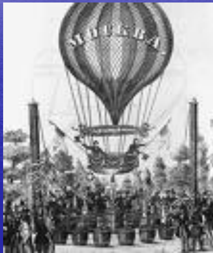
Один из братьев Монгольфье