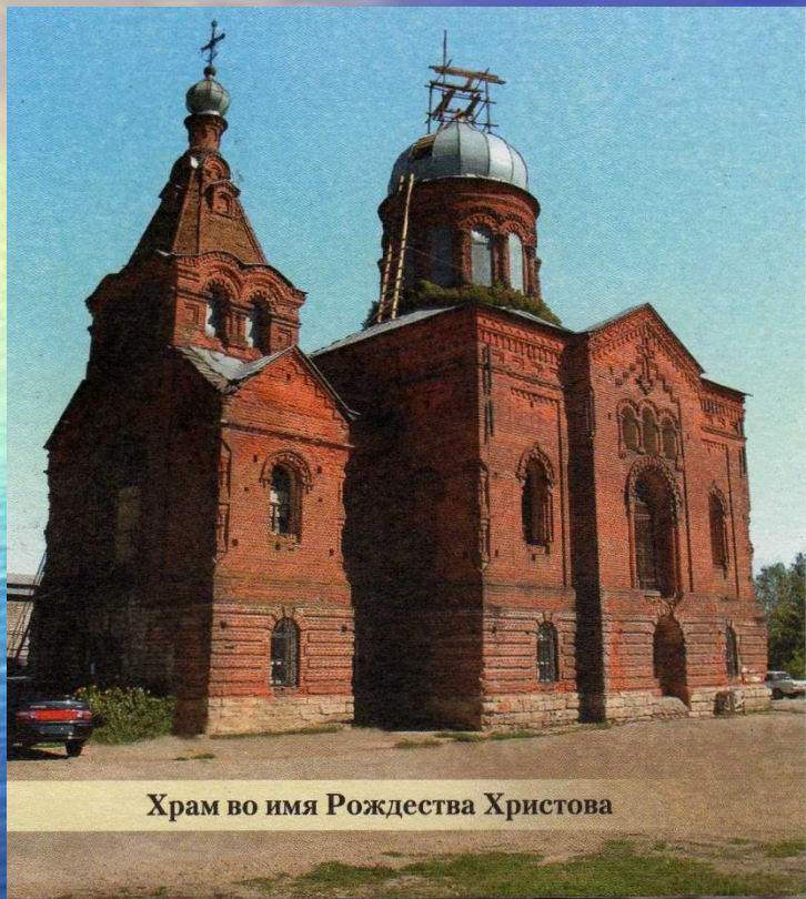
Храм во имя Рождества Христова

В 2005 году возобновились богослужения в еще одном храме, закрытом советской властью в 30-е годы. Вот что повествуют писцовые книги XVIII века о церкви Сторожевской слободы Данкова: «В Данкове же на посаде, на берегу реки Вязовенки, слобода сторожевых казаков, а в ней церковь во имя Рождества Христова, да придел Николы Чудотворца, древяна клецки с папертью...»