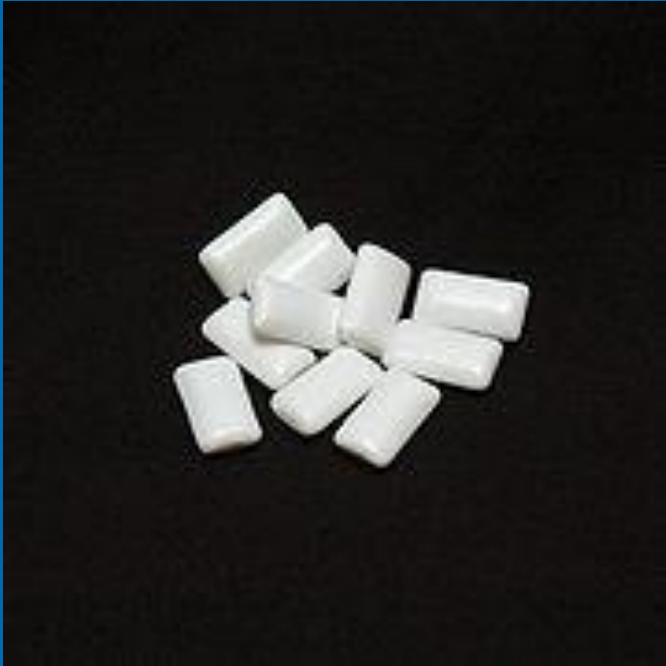
В виде подушечек