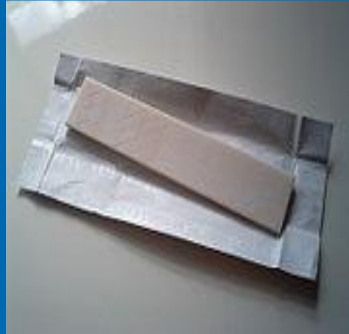
В виде пластин