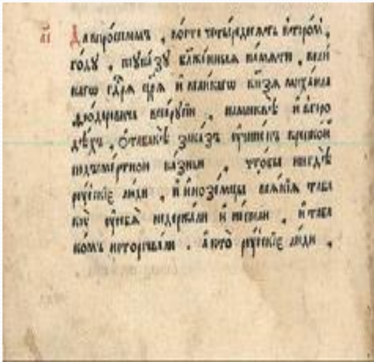
Соборное Уложение 1649 года, Фрагмент о табаке.