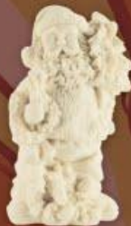
Санта с елкой