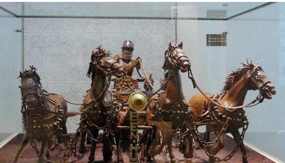
Музеи шоколада. Барселона, Кельн, Москва, Санкт Питербург, Покров