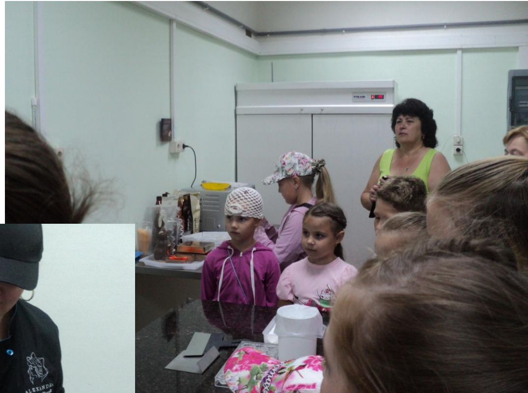
Экскурсия в шоколадный цех