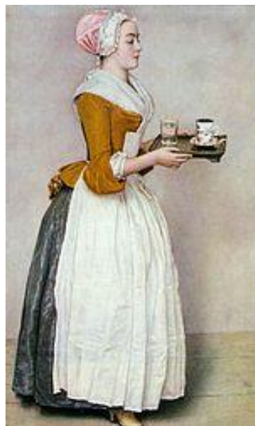
Ж. Э. Лиотар. «Шоколадница» (1745)

Однако позднее производителями шоколада стали итальянцы и голландцы. Их примеру последовали бельгийцы и немцы. С помощью дочери испанского короля Анны Австрийской, шоколад стал излюбленным напитком французов. Анна вышла замуж за французского короля Людовика VIII и внедрила сладость в страну. Затем шоколад стали изготавливать швейцарцы, а потом и весь мир.