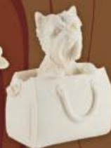
Собачка в сумке