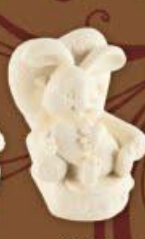
Зайка в кресле