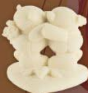
Мишки на сердце