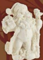
Санта с посохом