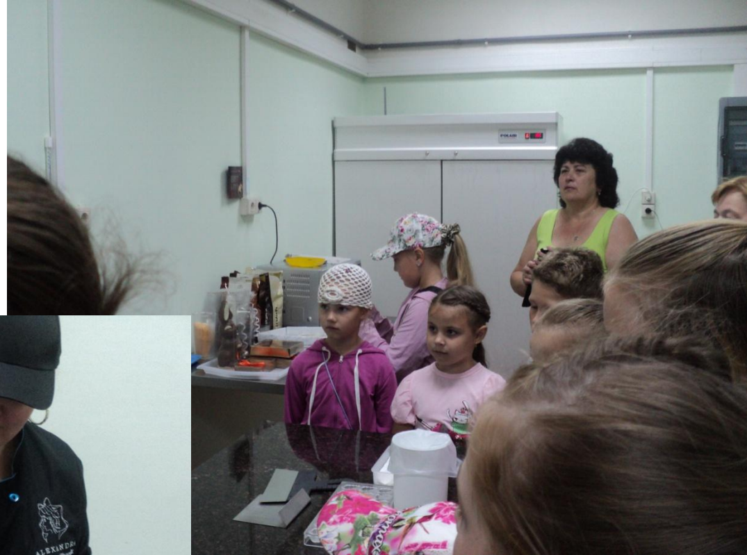
Экскурсия в шоколадный цех