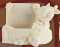
Бычок с сундучком