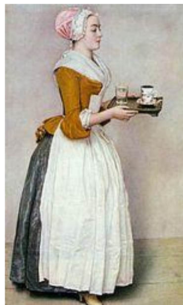
Ж. Э. Лиотар. «Шоколадница» (1745)

Однако позднее производителями шоколада стали итальянцы и голландцы. Их примеру последовали бельгийцы и немцы. С помощью дочери испанского короля Анны Австрийской, шоколад стал излюбленным напитком французов. Анна вышла замуж за французского короля Людовика VIII и внедрила сладость в страну. Затем шоколад стали изготавливать швейцарцы, а потом и весь мир.