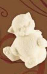
Котенок с сердцем