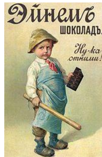
Дореволюционный шоколад фабрики Эйнема