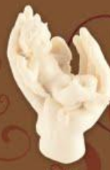
Ангел на руках