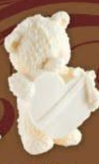
Мишка с сердцем