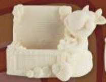
Бычок с сундучком