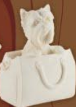
Собачка в сумке