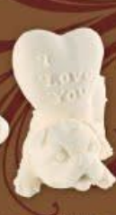
Собачка «I love you»