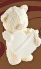
Мишка с сердцем