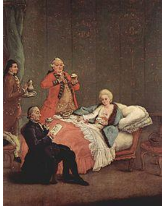
Картина «Утренний шоколад» венцианца Пьетро Лонги