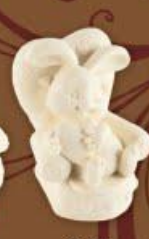
Зайка в кресле