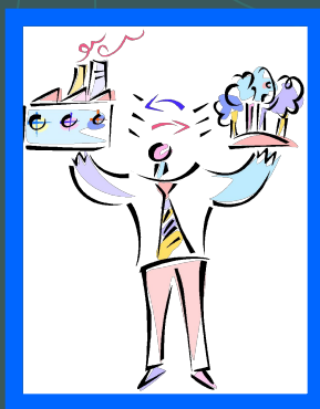
Ответственность перед обществом и людьми