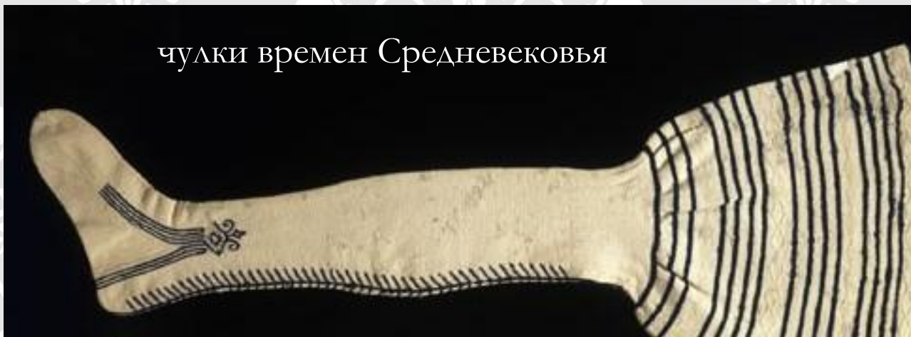
чулки времен Средневековья

Изначально вязаная одежда ценилась очень высоко и была недоступна простым смертным. Сегодня с трудом верится, что, например, во времена раннего средневековья позволить себе носить вязаные чулки могли разве что короли.