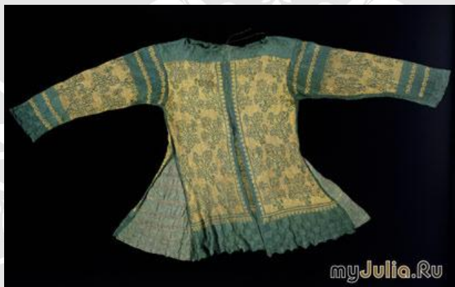
Жакет (Италия, 17-ый век), ручное вязание, шёлк

Расцвет вязания как ремесла приходится на XVI век, когда оно широко распространилось в Европе и даже превратилось в доходный промысел. А когда в 1589 году был изобретен вязальный станок и началось массовое изготовление трикотажа и изделий из него, вязаная одежда стала доступна каждому. К счастью, до сих пор ни на одной из машин не удалось повторить полотно, искусно связанное умелыми руками мастера, и поэтому изделия, изготовленные вручную, не только ценятся намного выше, чем фабричные, но и заслуженно возводятся в ранг произведений искусства.