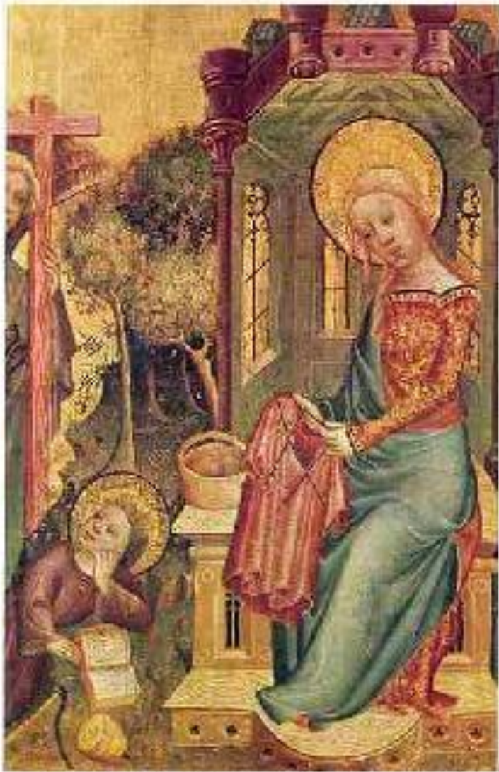
Богородица вяжет. Бертран Минден

Несколько европейских картин 14 века изображают Богоматерь за вязанием , например, “Посещение Ангела” 1400-1410 Мастера Бертрама Миндена.