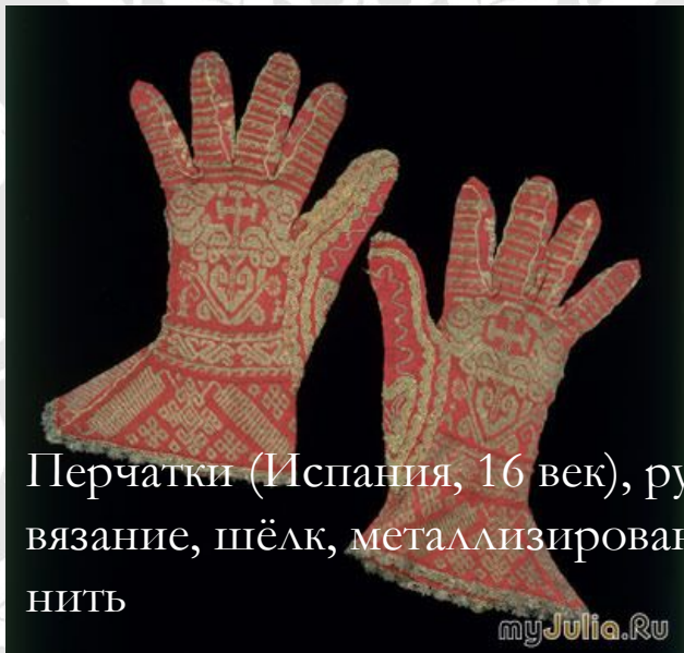
Перчатки (Испания, 16 век), ручное вязание, шёлк, металлизированная нить

Самые ранние известные вязанные изделия в Европе были сделаны мусульманскими вязальщицами, нанятыми членами испанской королевской семьи. Среди этих изделий обнаружили трикотажные наволочки и перчатки в гробнице принца Фернандо де ла Серда, умершего в 1275 году. Причём плотность и качество вязаного полотна наволочек сравнима с плотностью современного трикотажа машинной вязки — около двадцати петель на дюйм.