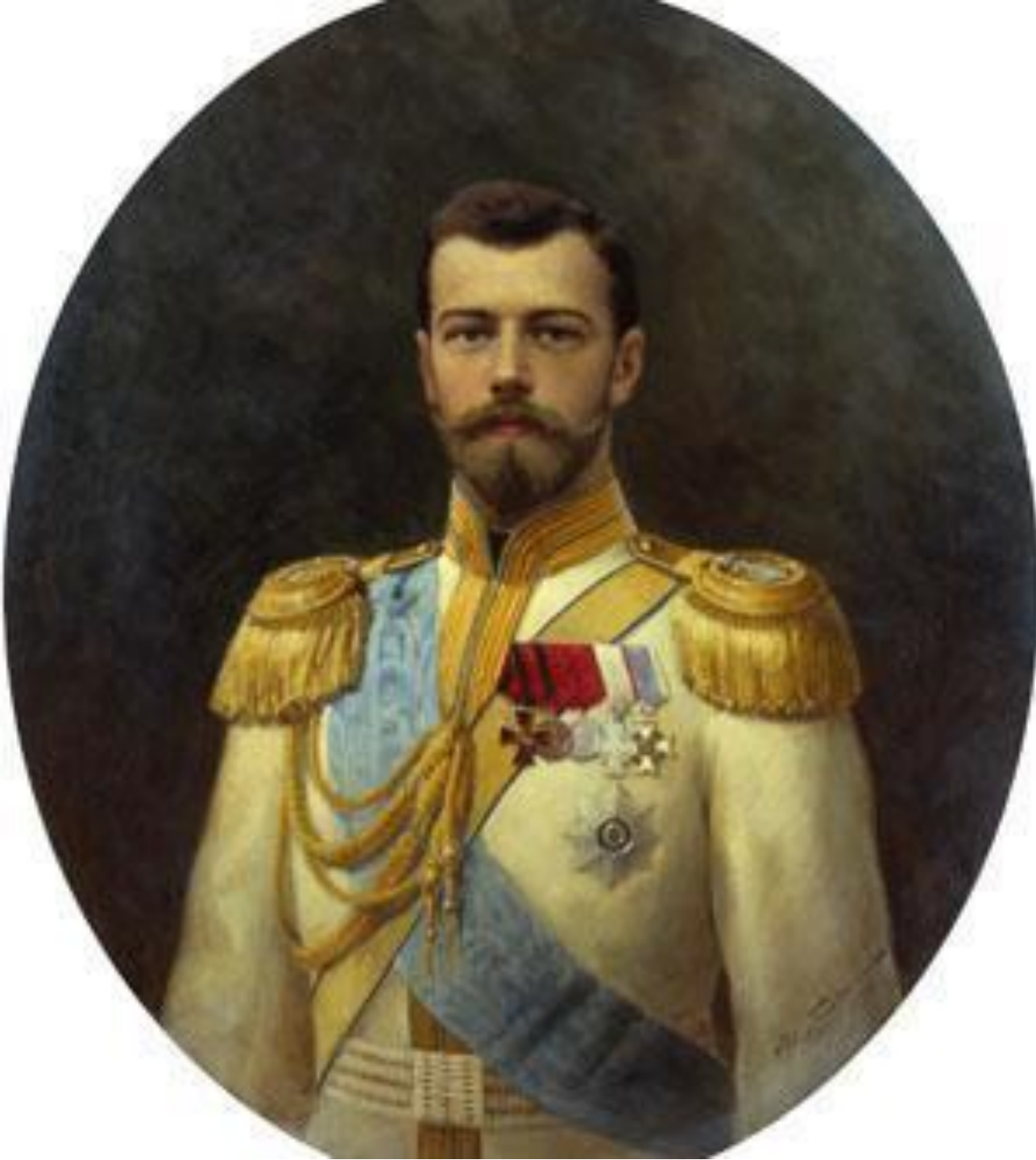
Император Николай Второй.