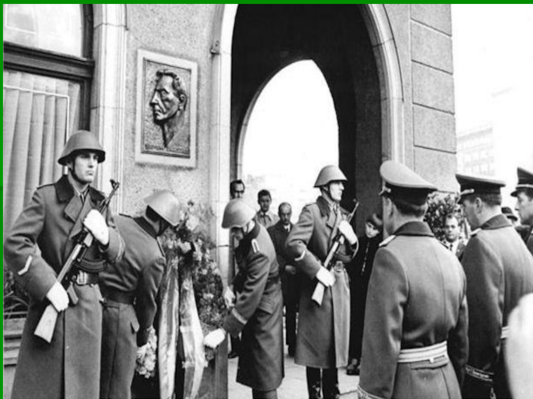
6. November 1969

Именем Зорге названы улицы во многих городах России. В Баку в его честь названы парк, одна из главных улиц. В Баку существует дом-музей Р. Зорге.