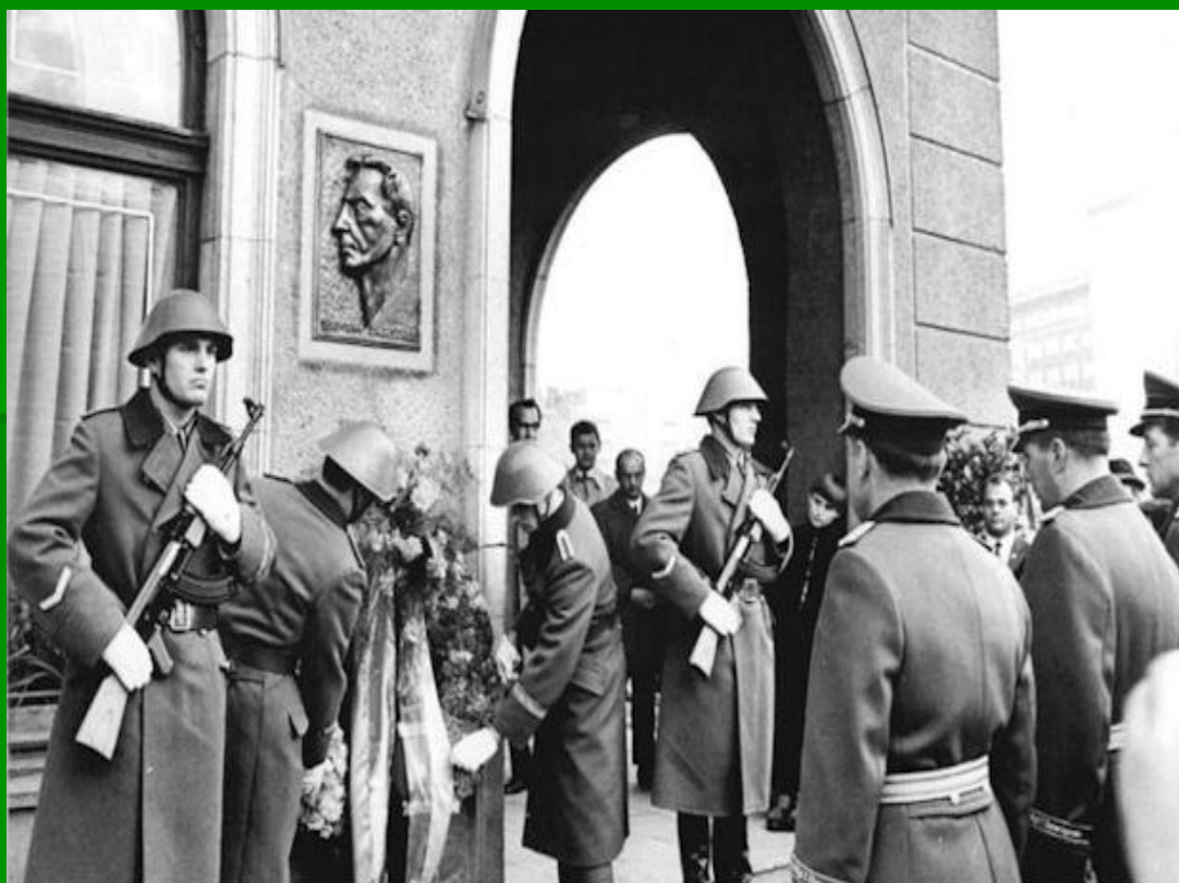
6. November 1969

Именем Зорге названы улицы во многих городах России. В Баку в его честь названы парк, одна из главных улиц. В Баку существует дом-музей Р. Зорге.