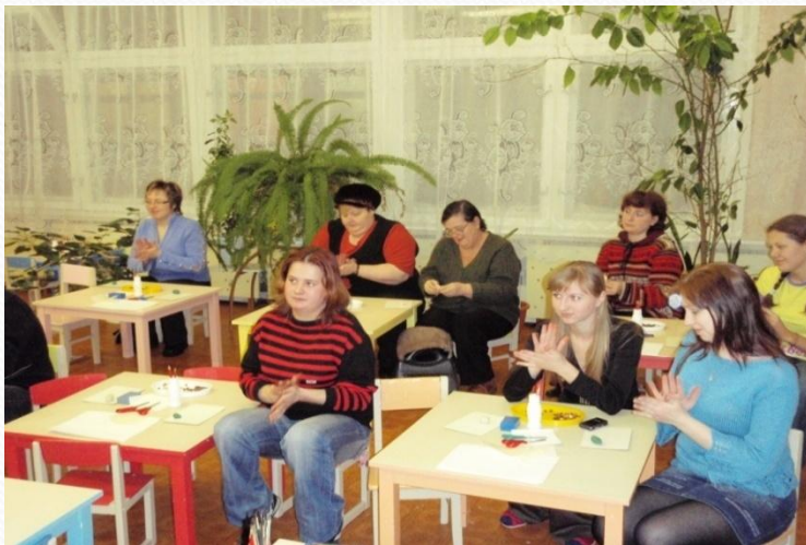
«Учимся лепить животных»