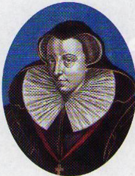
Мария Стюарт (1542-1587) – королева Шотландии. Жила во Франции, овдовев, вернулась на родину. Обвиненная в убийстве второго мужа, бежала в Англию, была заключена в тюрьму. Казнена в 1587 году