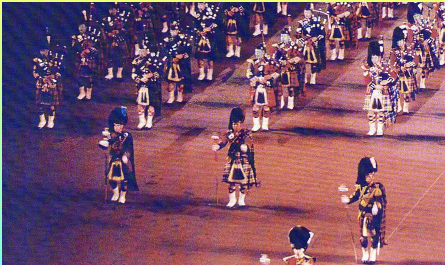
Военный парад. Волынщики и барабанщики