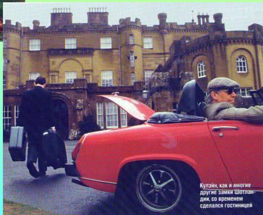
Кулзйн, как и многие другие замки Шотландии, со временем сделался гостиницей