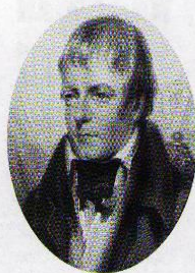
Вальтер Скотт (1771-1832) – шотландский поэт, собиратель фольклора, прозаик. Создал жанр исторического романа («Айвенго», «Квентин Дорвард»). Самые известные «шотландские» романы – «Пуритане» и «Роб Рой»