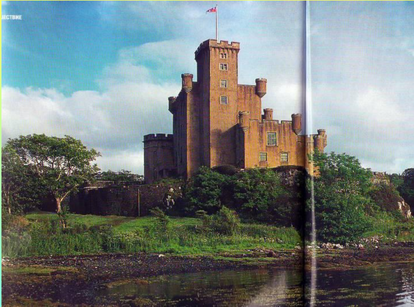
Замок Выбегание на острове Скай