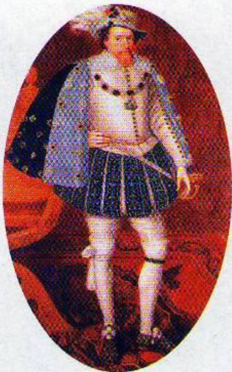
Яков VI (1566-1625) – сын Марии Стюарт и племянник английской королевы Елизаветы I. В 1603 году стал королем Англии, Шотландии и Ирландии под именем Якова I