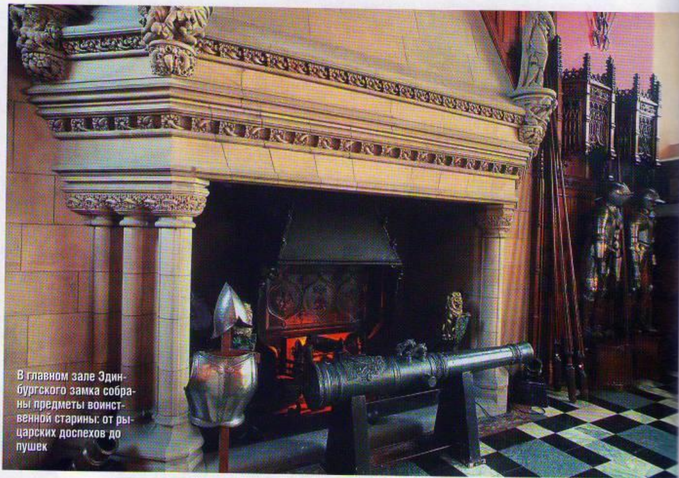
В главном зале Эдинбургского замка собраны предметы воинственной старины: от рыцарских доспехов до пушек