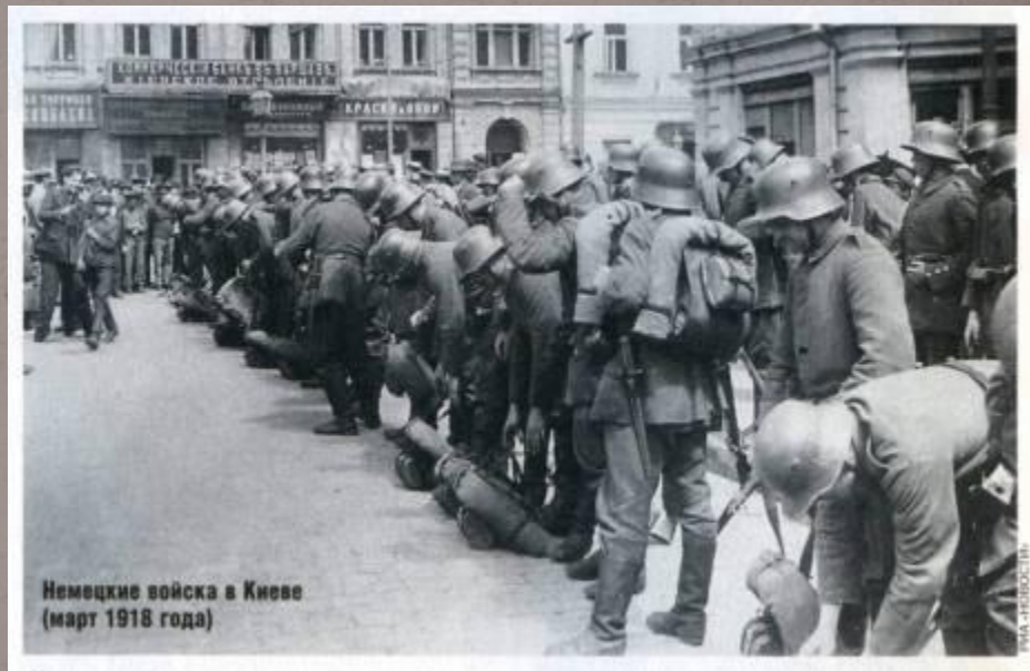
Немецкие войска в Киеве, март 1918 г.