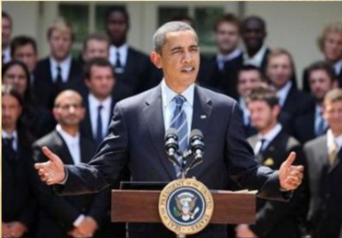
Figura 6. Președintele Barack Obama ține un discurs la reuniunea campionilor sportivi din echipa "Columbus Crew", în 2008

□ Когда указательный палец направлен вертикально к виску, а большой поддерживает подбородок, человек негативно оценивает сообщение; приближение указательного пальца к веку свидетельствует об усилении негативизма.