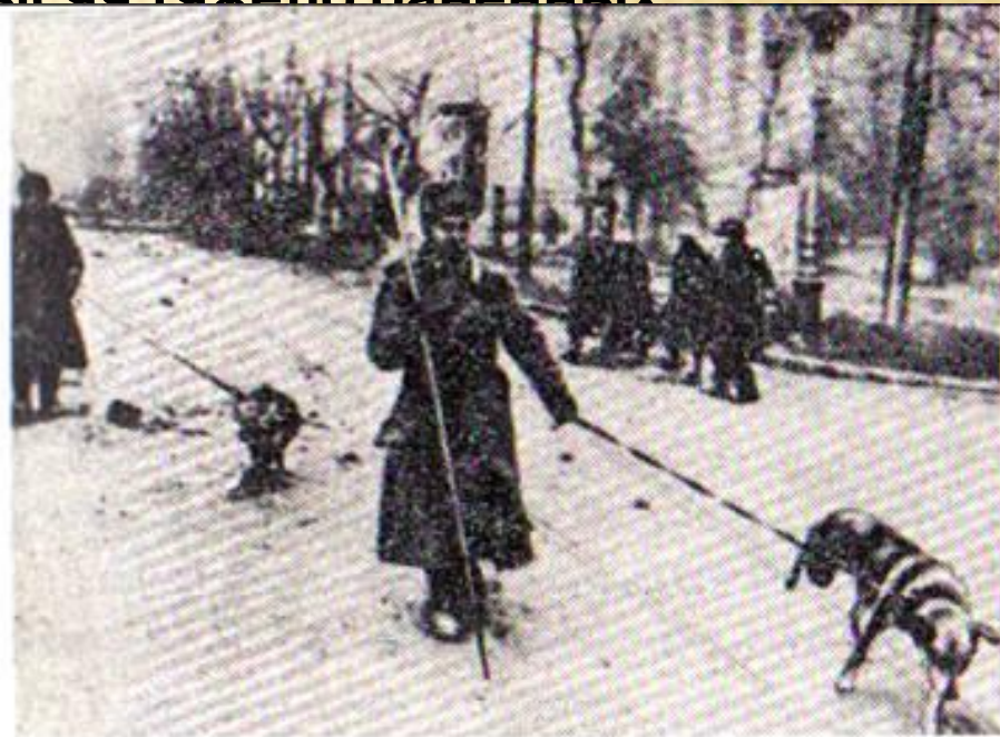
Только что ушел враг. Собаки ищут в городе мины.

Собаки- санитары - вывезли 700 тысяч тяжело раненных бойцов.