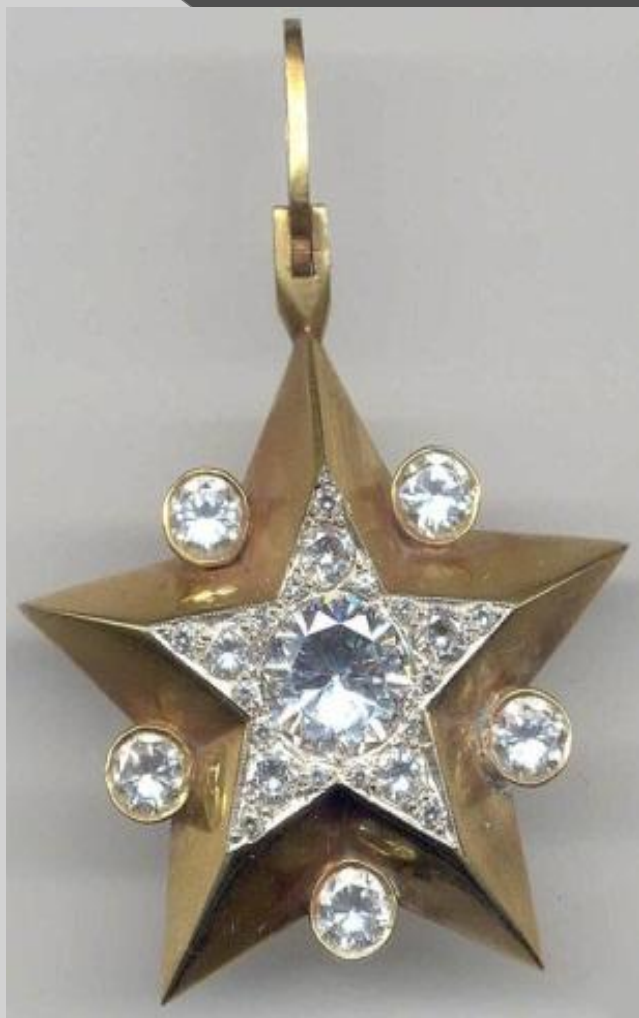
Маршальская Звезда «большого» типа