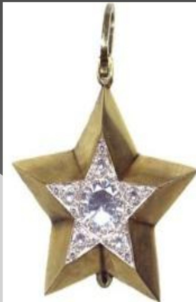
Маршальская Звезда «малого» типа