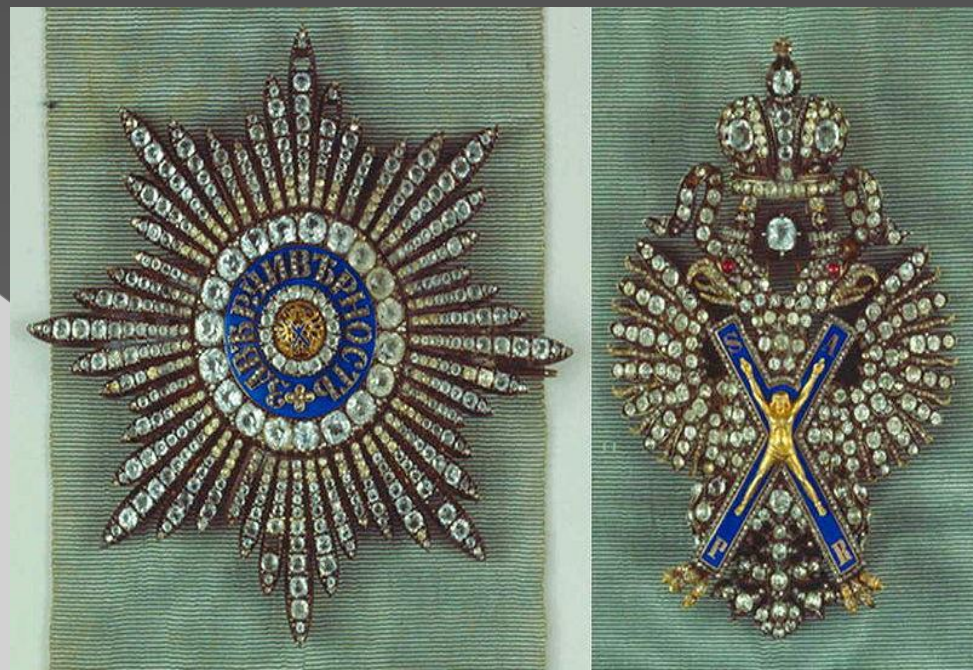
Звезда и знак ордена Св. апостола Андрея Первозванного с бриллиантами

Учрежден в 1698 (или 1699 году) Петром I и до 1714 года, когда был учрежден орден Св. Екатерины, являлся единственным орденом Российской империи. Первым кавалером ордена стал дипломат Фёдор Головин в 1699.