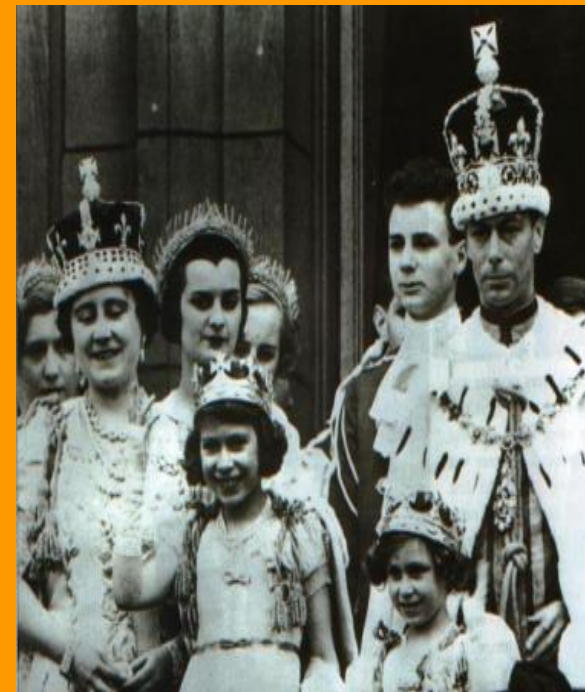
ЕЛИЗАВЕТА ВТОРАЯ С РОДИТЕЛЯМИ И СЕСТРОЙ

Королева Елизавета II родилась 21 апреля 1926 года в Лондоне.