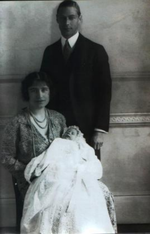
ЕЛИЗАВЕТА ВТОРАЯ С РОДИТЕЛЯМИ