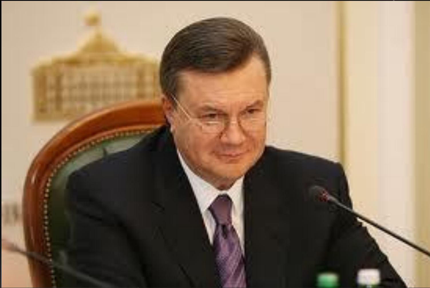
Янукович Виктор Фёдорович