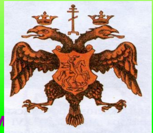
Герб в середине 16 в