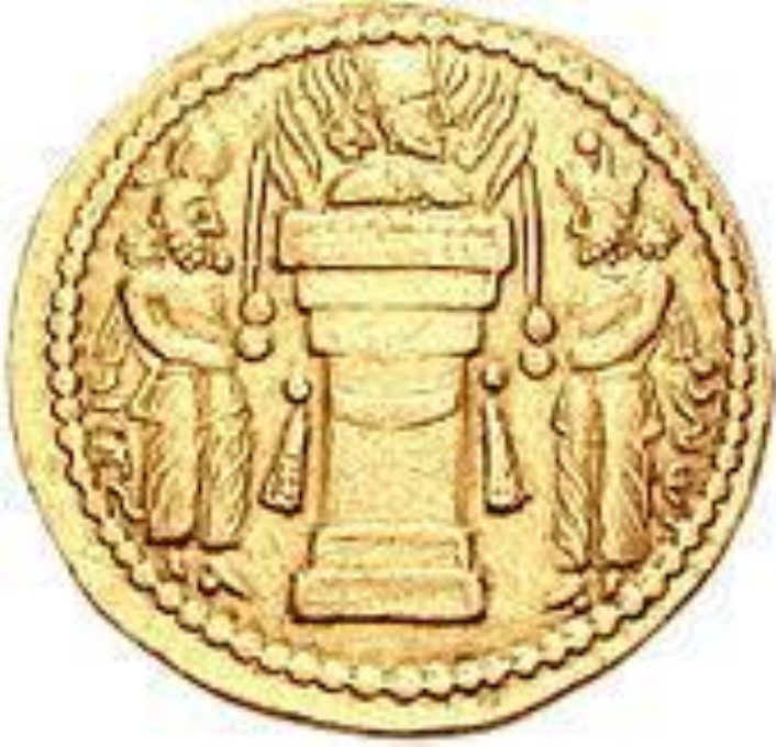
Реверс монеты Ормизда II, изображение алтаря огня и двух священников