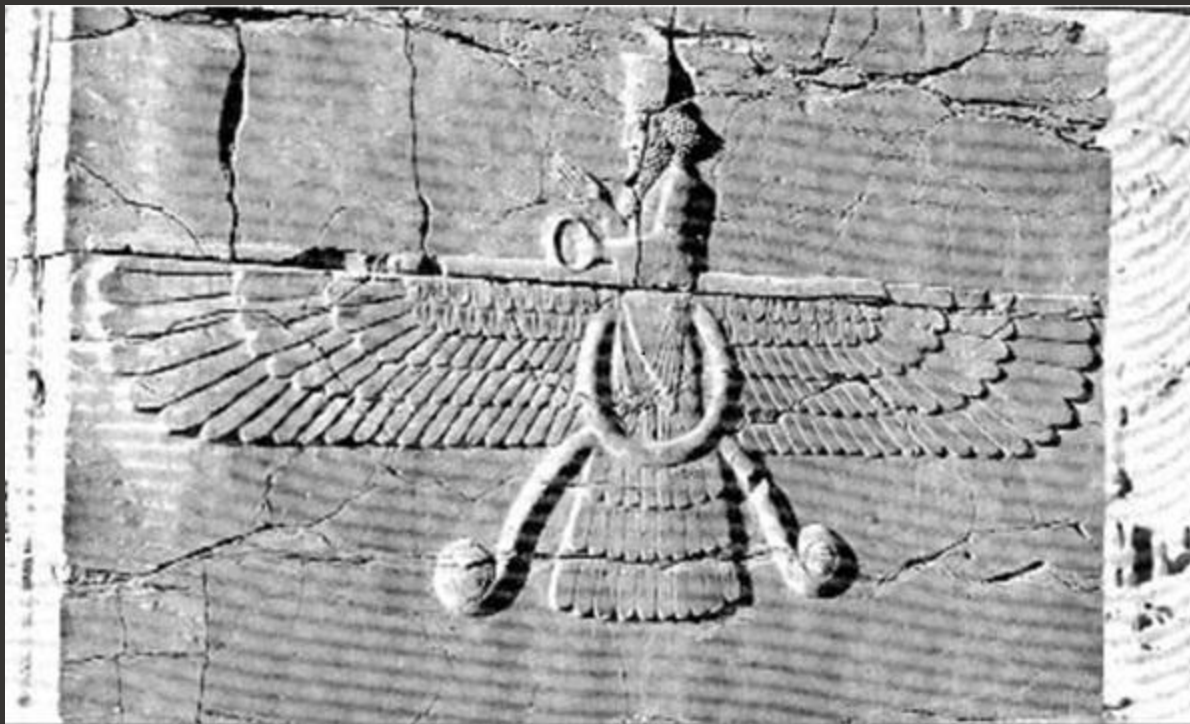
Persepolis, 5 th century B.C.

Таким образом имя Ахура Мазда можно условно перевести как «Господь Мудрый», «Господь Мудрость», «Владыка мысли».