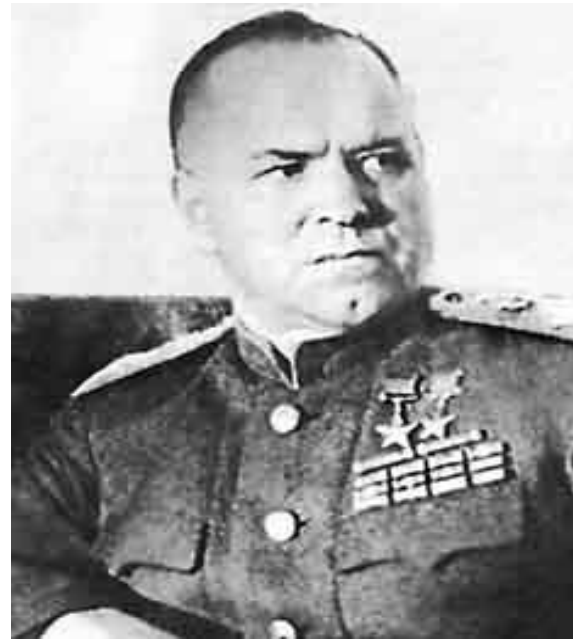
5. Георгий Жуков.