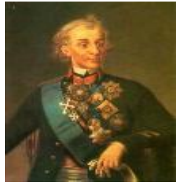
3. Александр Суворов.