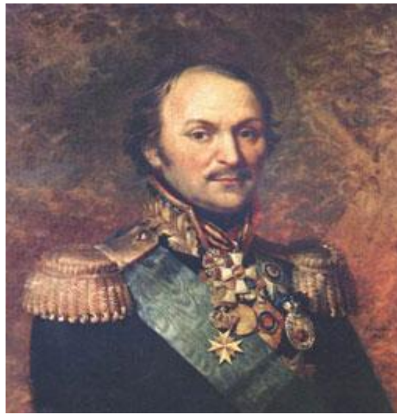
2. Матвей Платов.