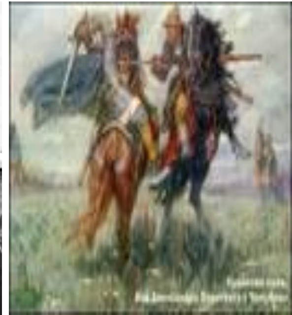
6. Дмитрий Донской.