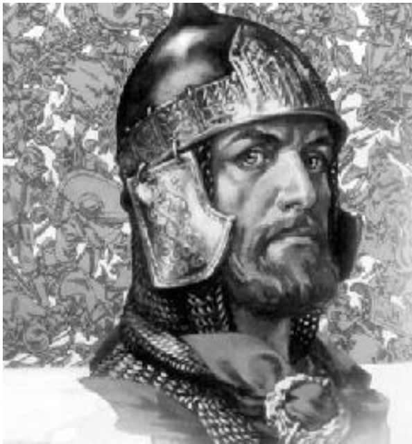
4. Александр Невский.