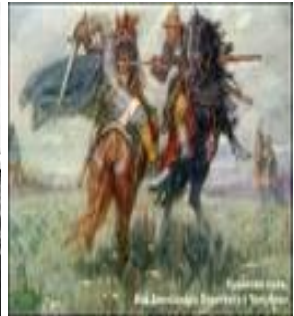
6. Дмитрий Донской.