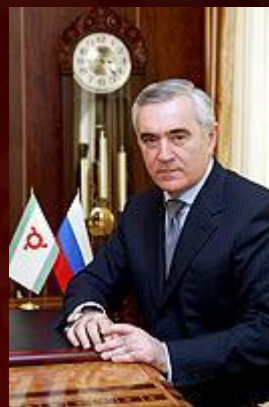
Мура́т Магоме́тович Зя́зиков