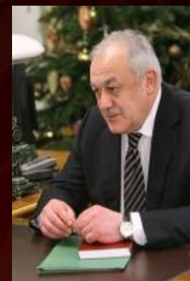
Таймура́з Дзамбе́кович Ма́мсуров