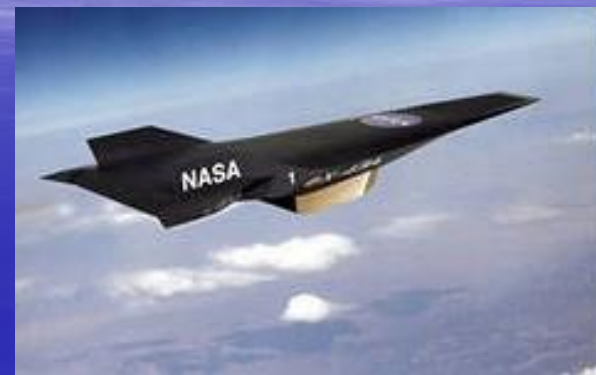
гиперзвуковой, наса, беспилотный, Самолёт, наса, х-43а