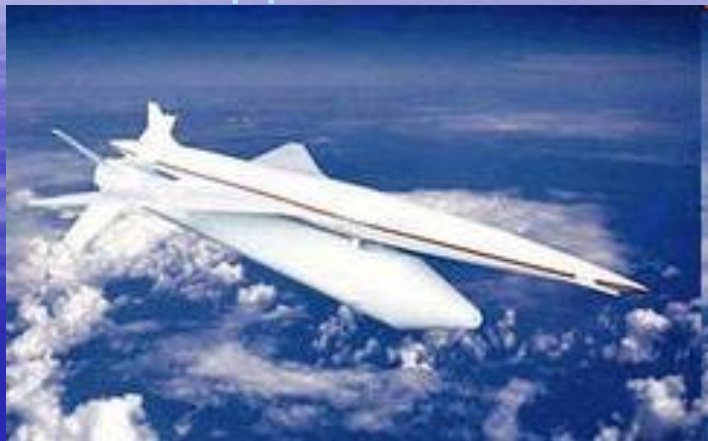
японского сверхзвукового самолета NEXST1.

В послевоенные годы советская авиация стала переходить на реактивные самолеты. А в 1950-х годах началась эра сверхзвуковой авиации.