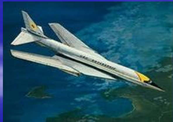
Boeing-733 Сверхзвуковой пассажирский самолет.