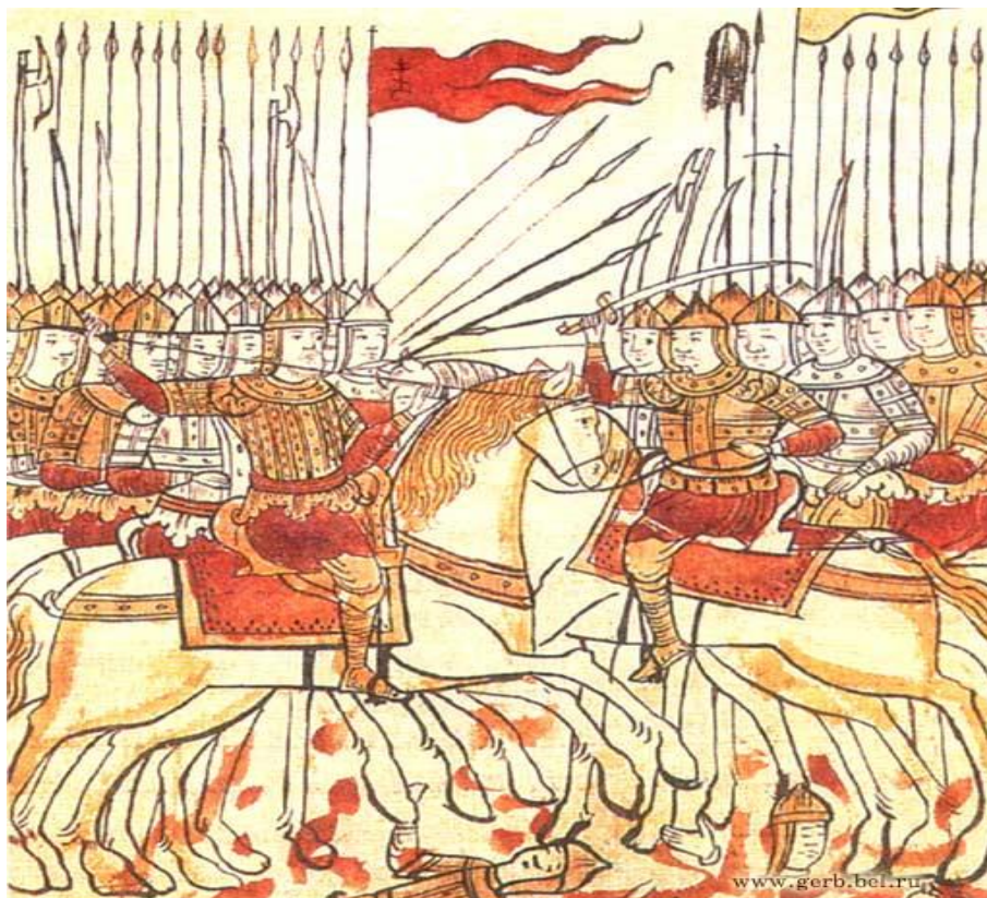
Битва на Куликовом поле. Миниатюра. XVI век.

С конца 14 века слово "стяг" стало постепенно заменяться словом "знамя". В свою очередь слово "знамя" происходит от старинного слова "знамение", которое имело смысл знаменовать, означать. В старинных рукописях впервые слово "знамя" (знамение) было применено к названию стяга Дмитрия Донского. В стрелецких войсках (середина 16 века) в каждом полку и в каждой сотне имелись свои знамена. Сотенные знамена именовались "меньшими" знаменами, а полковые - "большими".