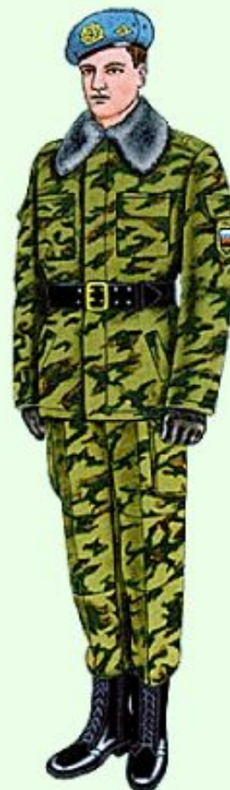
Парадная для строя в ВДВ