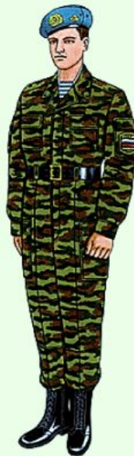
Парадная для строя и вне строя в ВДВ