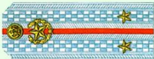
Лейтенант (парадная форма одежды)