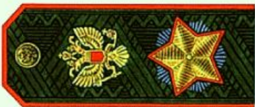
Маршал Российской Федерации (повседневная форма одежды)