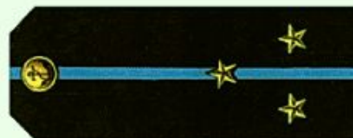
Старший лейтенант (повседневная форма одежды, морская авиация)