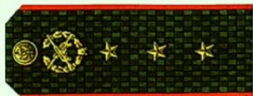
Старший прапорщик (повседневная форма одежды)