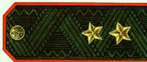
Генерал-лейтенант (повседневная форма одежды)