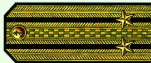
Капитан 2 ранга (парадная форма одежды)