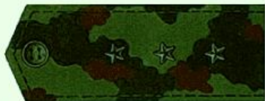
Старший прапорщик (полевая форма одежды)