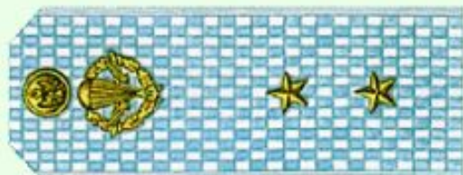
Прапорщик (парадная форма одежды, ВДВ)