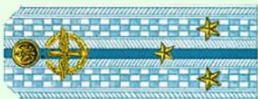
Старший лейтенант (парадная форма одежды, ВВС)