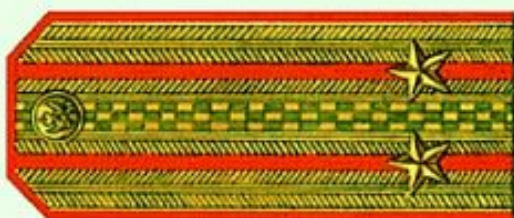
Подполковник (парадная форма одежды)