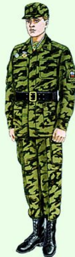
Повседневная для строя и вне строя