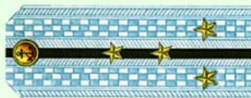
Капитан-лейтенант (парадная форма одежды, ВМФ)