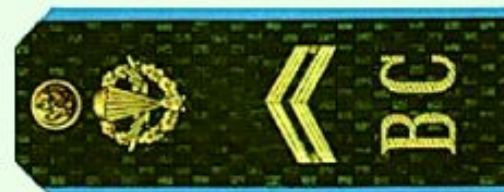
Младший сержант (ВДВ)