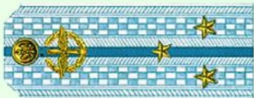
Старший лейтенант (парадная форма одежды, ВВС)