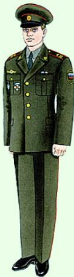
Парадная вне строя