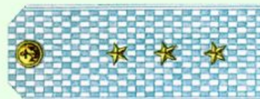
Старший мичман (парадная форма одежды, ВМФ)