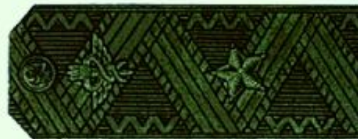
Генерал-майор (полевая форма одежды)