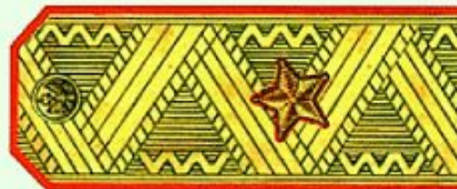
Генерал-майор (парадная форма одежды)