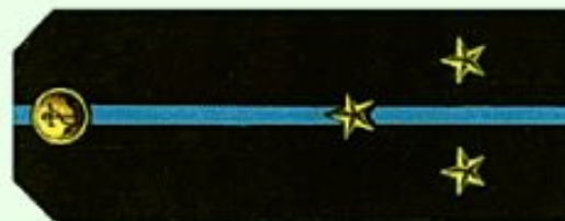
Старший лейтенант (повседневная форма одежды, морская авиация)