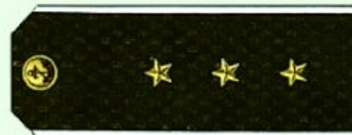
Старший мичман (повседная форма одежды, ВМФ)