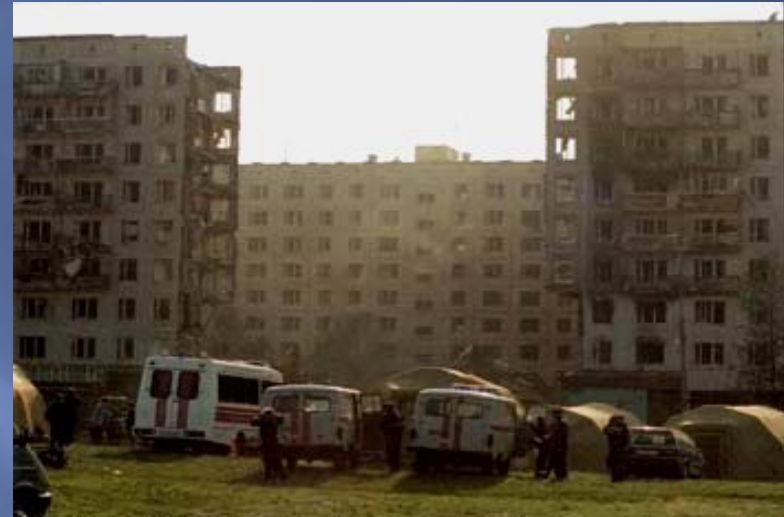
Взрывы жилых домов в Каспийске, Буйнакске, Волгоградске .