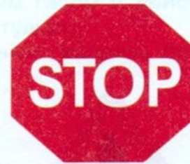
Движение без остановки запрещено