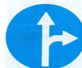
Движение прямо или направо