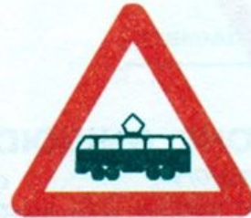
Пересечение с трамвайной линией