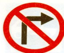
Поворот направо запрещен