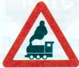
Железнодорожный переезд без шлагбаума