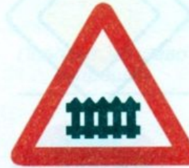
Железнодорожный переезд со шлагбаумом

Дорожные знаки этой группы предупреждают о приближении к опасному участку дороги; имеют форму треугольника.