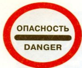
Опасность (запрещается дальнейшее движение в связи с дорожно-транспортным происшествием, аварией или другой опасностью)