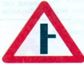
Примыкание второстепенной дороги