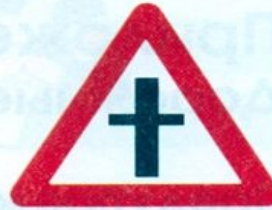
Пересечение со второстепенной дорогой