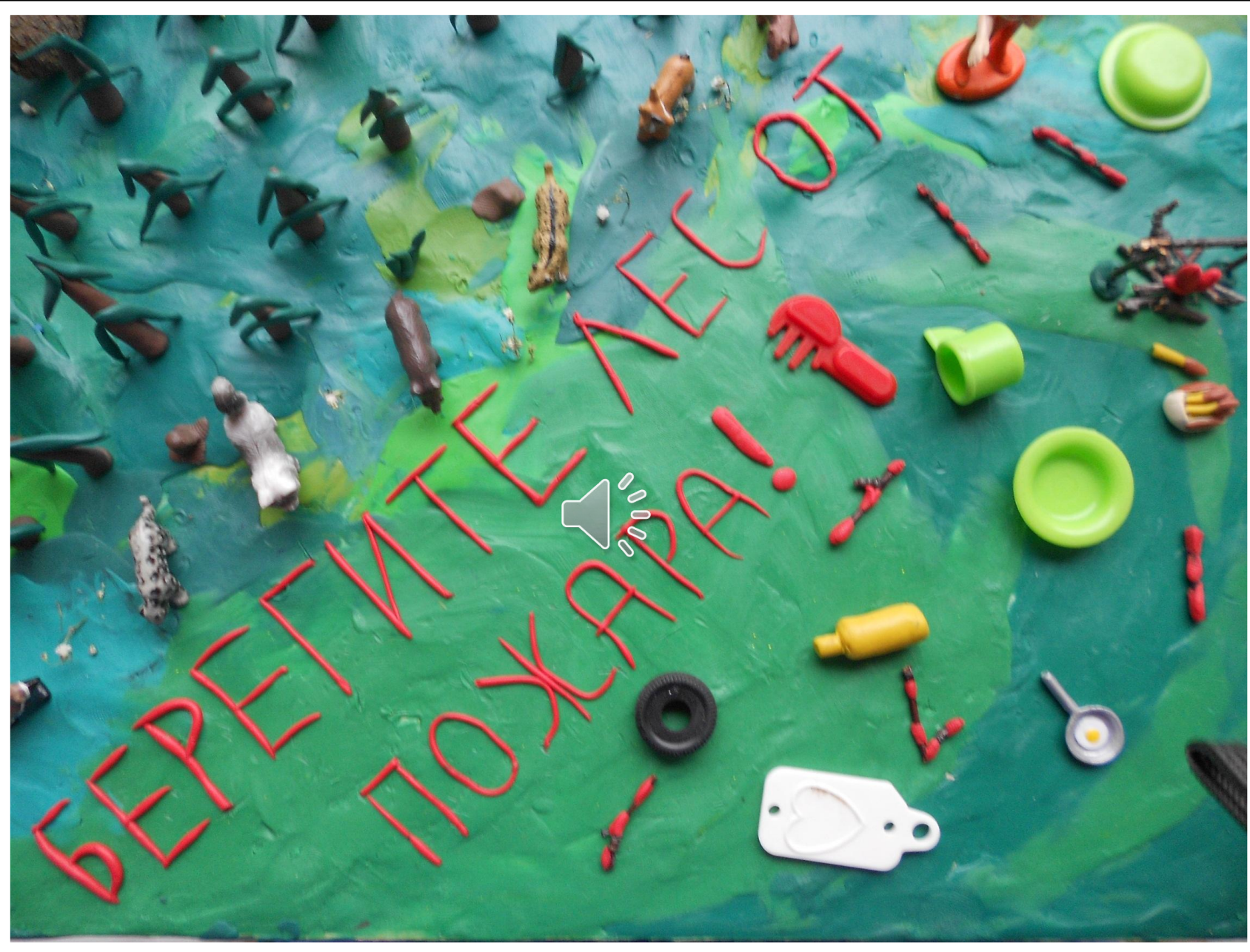
Муниципальное казённое общеобразовательное учреждение основная общеобразовательная школа №4 6 класс ППБ